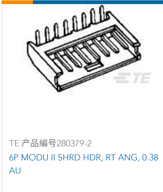
TE 产品编号280379-2 6P MODU II SHRD HDR, RT ANG, 0.38 AU