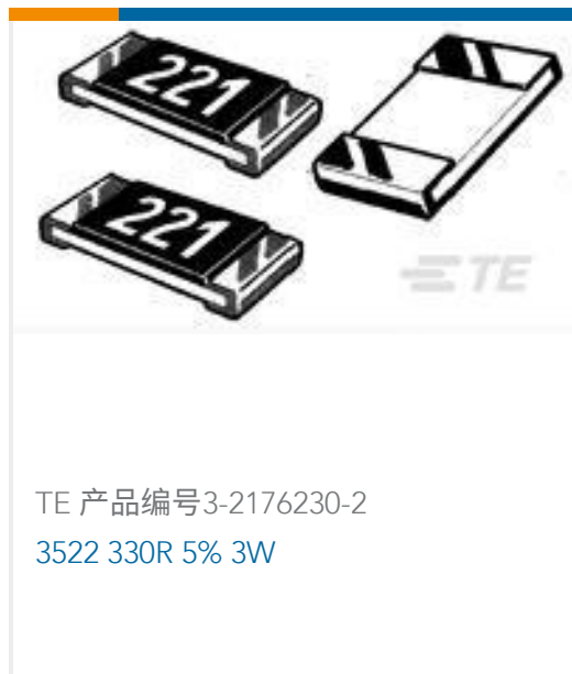
TE 产品编号3-2176230-2 3522 330R 5% 3W