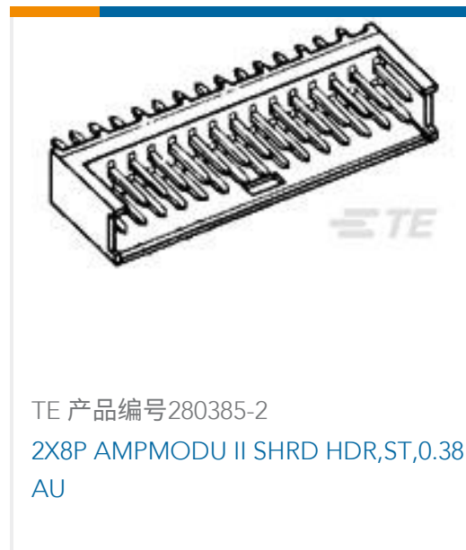
TE 产品编号280385-2 2X8P AMPMODU II SHRD HDR,ST,0.38 AU