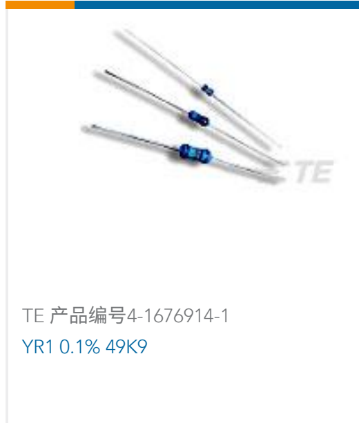
TE 产品编号4-1676914-1 YR1 0.1% 49K9