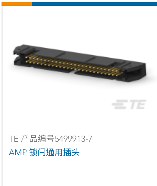
TE 产品编号5499913-7 AMP 锁门通用插头