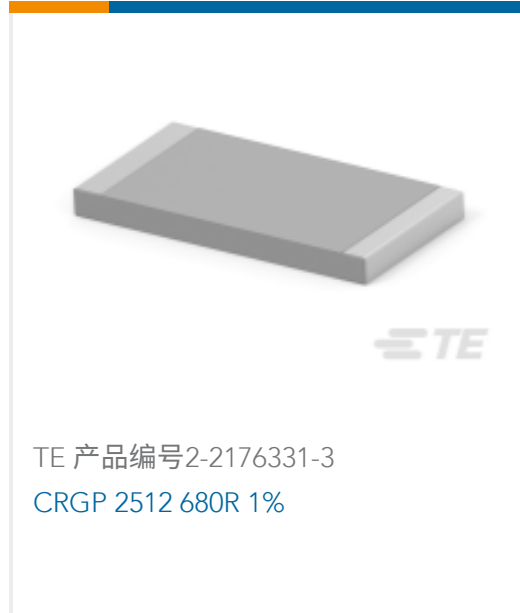
TE 产品编号2-2176331-3 CRGP 2512 680R 1%