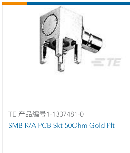
TE 产品编号1-1337481-0 SMB R/A PCB Skt 50Ohm Gold Plt