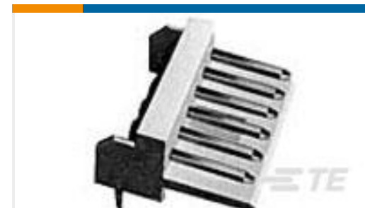
TE 产品编号171826-5 POST HDR ASSY HDR AMP EI CONN