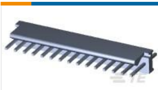
TE 产品编号1-640456-5 15P MTA100 HDR ASSY F/L SQ STR