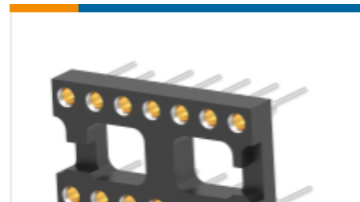
TE 产品编号4-1571552-3 DIP 插座：标准，冲压成型，开放式，镀金