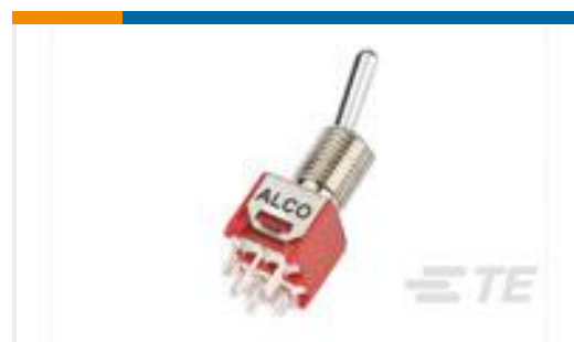
TE 产品编号2267077-1 TMS1T4B5M2RE