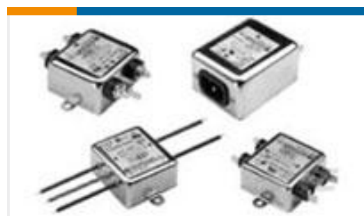
TE 产品编号1-6609027-5 10EK7=F7095 S0