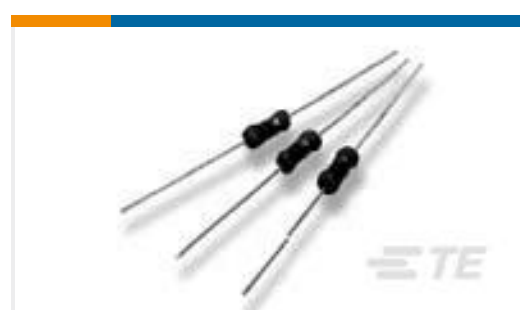
TE 产品编号9-1879352-1 RR02 5% 1K8 AMMO