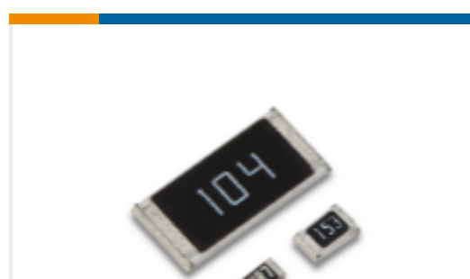
TE 产品编号2176347-6 CRGCO 2010 27R 1%