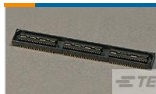
TE 产品编号2-1658012-3 MSB0.80RC-ASY120FL,-,10,-TY