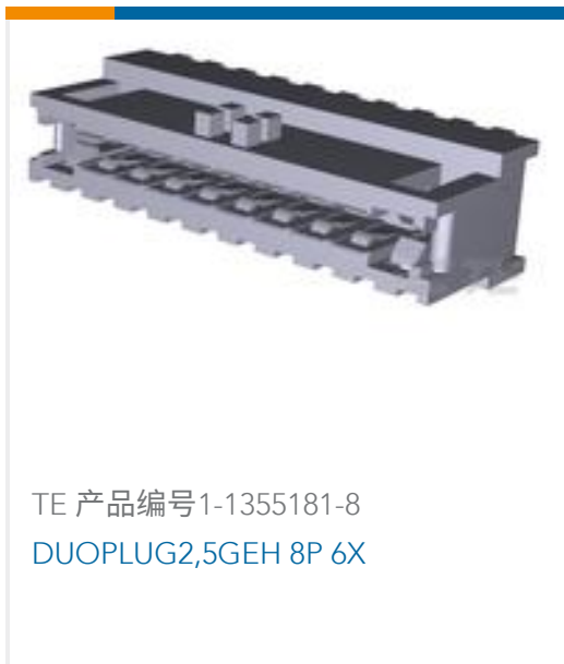
TE 产品编号1-1355181-8 DUOPLUG2,5GEH 8P 6X