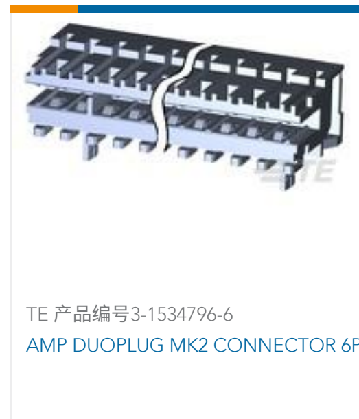
TE 产品编号3-1534796-6 AMP DUOPLUG MK2 CONNECTOR 6P