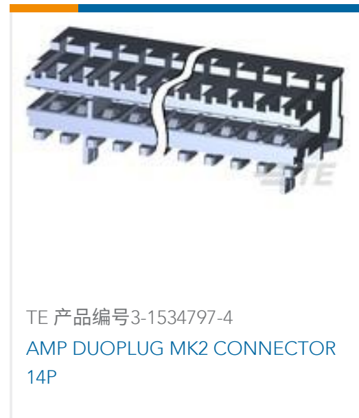
TE 产品编号3-1534797-4 AMP DUOPLUG MK2 CONNECTOR 14P