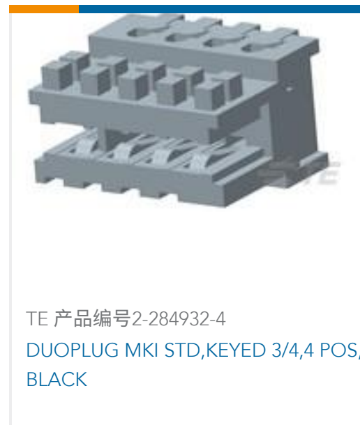
TE 产品编号2-284932-4 DUOPLUG MKI STD,KEYED 3/4,4 POS, BLACK