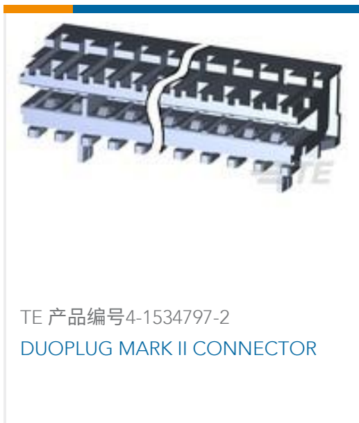
TE 产品编号4-1534797-2 DUOPLUG MARK II CONNECTOR