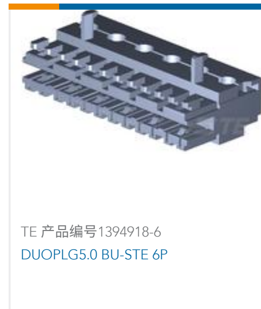
TE 产品编号1394918-6 DUOPLG5.0 BU-STE 6P