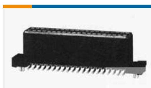
TE 产品编号 5-104550-7 60 SYS50 SURFMNT DRST RCPT SN