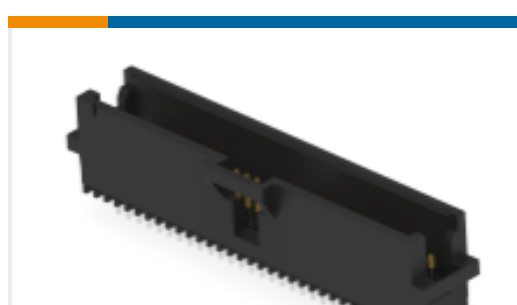
TE 产品编号 5-104068-6 60 SYSTEM 50 HDR DRST SHRD