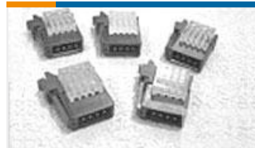
TE 产品编号1473562-8 RITS CONN. PLUG ASSY 8P YELLOW