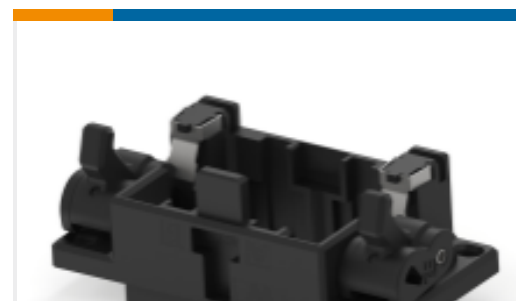
TE 产品编号2390404-1 DYNAMIC FRAME PANEL W KEY 2 MODULE