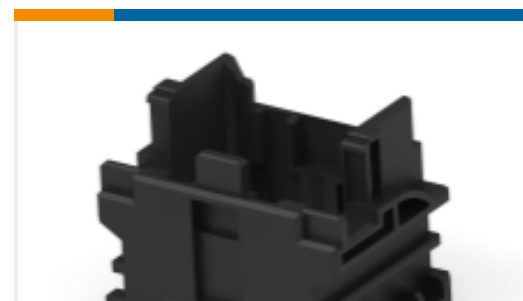
TE 产品编号2390402-1 DYNAMIC FRAME CABLE W KEY 2 MODULE