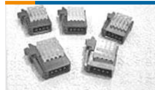
TE 产品编号1473562-6 RITS CONN. PLUG ASSY 6P YELLOW