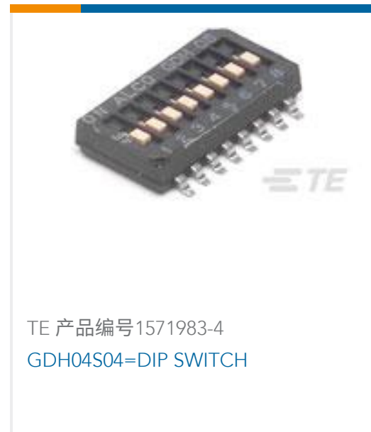
TE 产品编号1571983-4 GDH04S04=DIP SWITCH