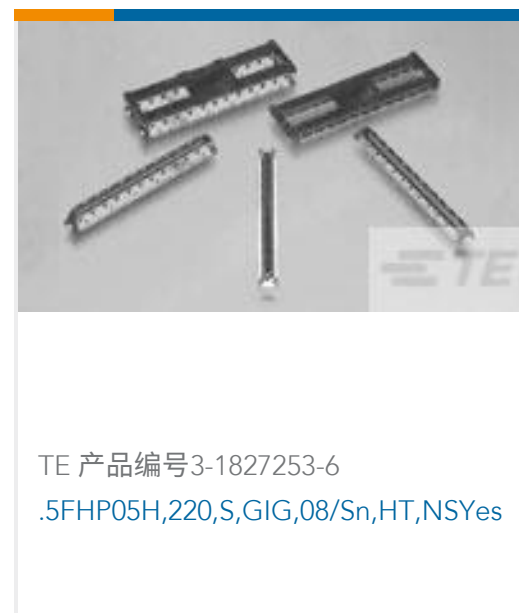
TE 产品编号3-1827253-6 .5FHP05H,220,S,GIG,08/Sn,HT,NSYes