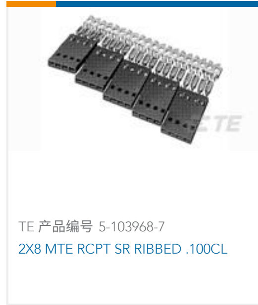
TE 产品编号 5-103968-7 2X8 MTE RCPT SR RIBBED .100CL