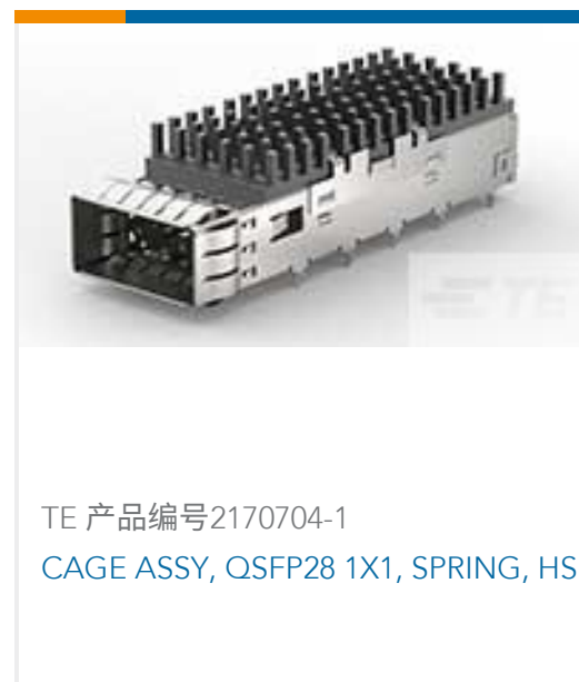
TE 产品编号2170704-1 CAGE ASSY, QSFP28 1X1, SPRING, HS