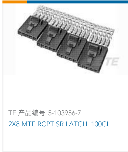
TE 产品编号 5-103956-7 2X8 MTE RCPT SR LATCH .100CL