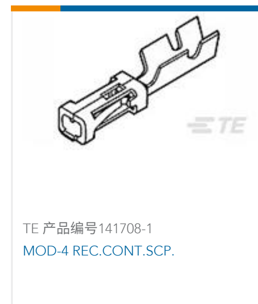
TE 产品编号141708-1 MOD-4 REC.CONT.SCP.