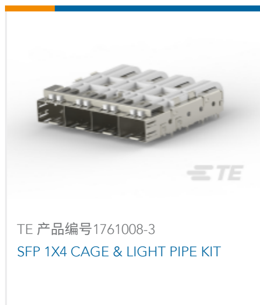
TE 产品编号1761008-3 SFP 1X4 CAGE & LIGHT PIPE KIT