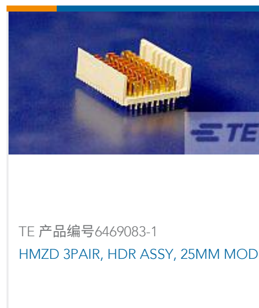
TE 产品编号6469083-1 HMZD 3PAIR, HDR ASSY, 25MM MOD