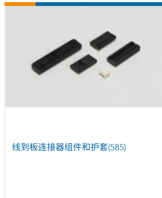
线到板连接器组件和护套(585)