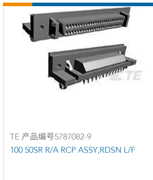
TE 产品编号5787082-9 100 50SR R/A RCP ASSY,RDSN L/F