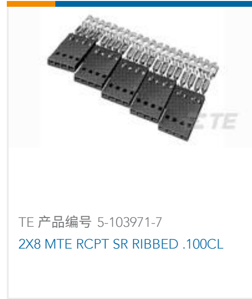
TE 产品编号 5-103971-7 2X8 MTE RCPT SR RIBBED .100CL