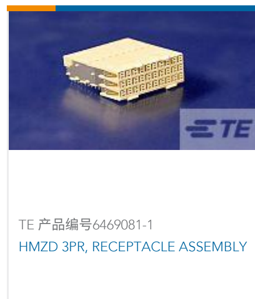
TE 产品编号6469081-1 HMZD 3PR, RECEPTACLE ASSEMBLY