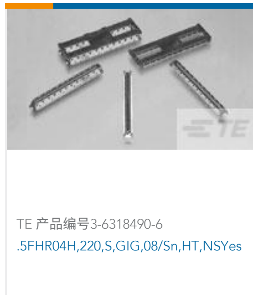
TE 产品编号3-6318490-6 .5FHR04H,220,S,GIG,08/Sn,HT,NSYes