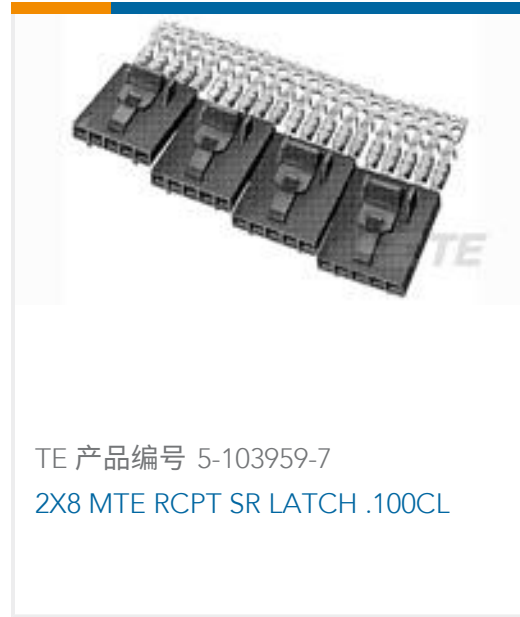
TE 产品编号 5-103959-7 2X8 MTE RCPT SR LATCH .100CL