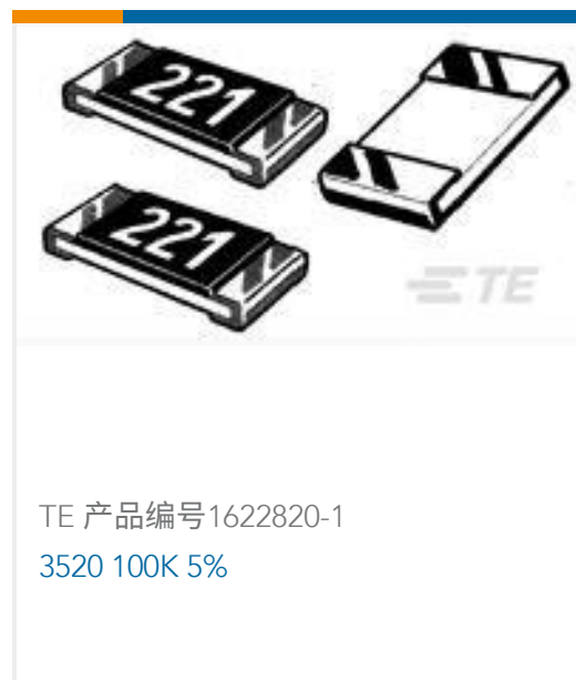
TE 产品编号1622820-1 3520 100K 5%