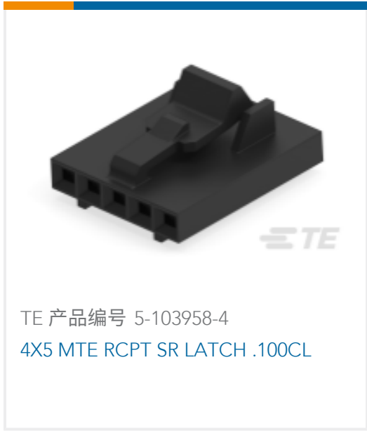
TE 产品编号 5-103958-4 4X5 MTE RCPT SR LATCH .100CL