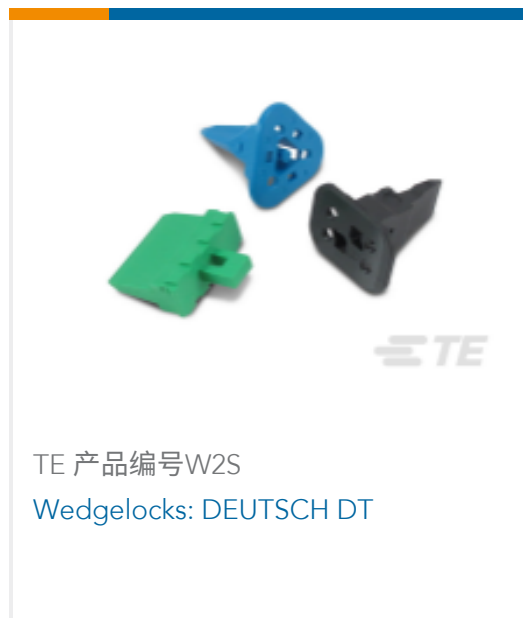
TE 产品编号W2S Wedgelocks: DEUTSCH DT