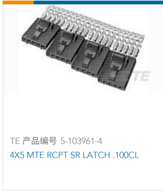
TE 产品编号 5-103961-4 4X5 MTE RCPT SR LATCH .100CL