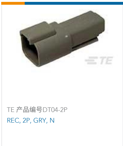
TE 产品编号DT04-2P REC, 2P, GRY, N