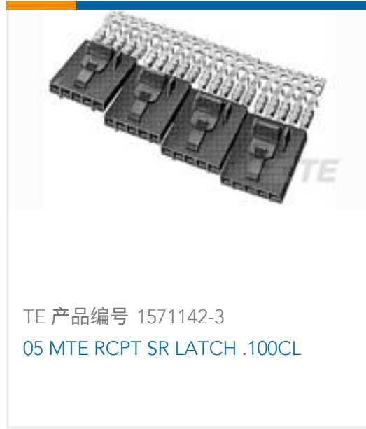
TE 产品编号 1571142-3 05 MTE RCPT SR LATCH .100CL