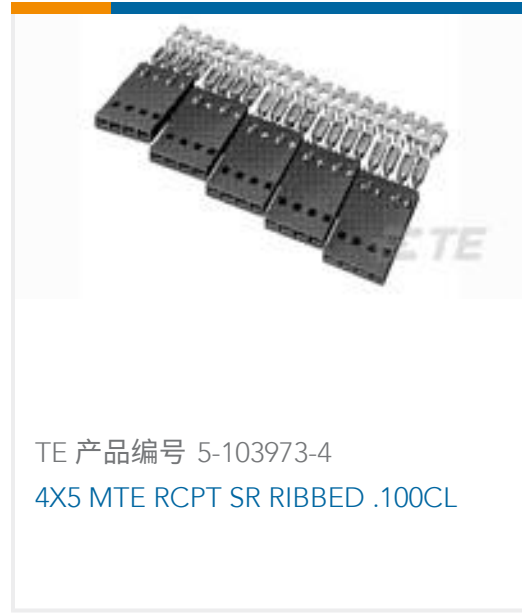
TE 产品编号 5-103973-4 4X5 MTE RCPT SR RIBBED .100CL