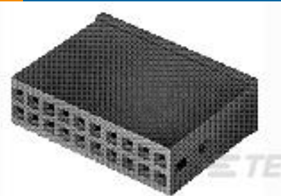
TE 产品编号 87131-2 10 LOCKING CLIP HSG DR .100CL