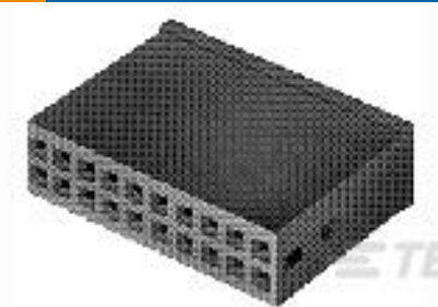
TE 产品编号 87132-2 10 LOCKING CLIP HSG DR .100CL