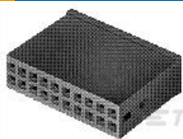
TE 产品编号 87133-5 10 LOCKING CLIP HSG DR MRKD