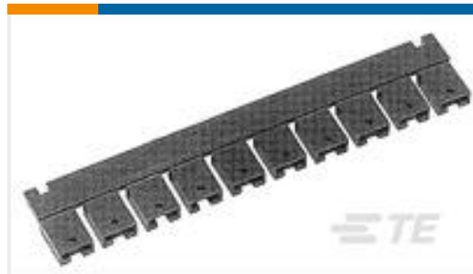
TE 产品编号2-382811-1 SHUNT, ECON, PHBRNSN, BLACK