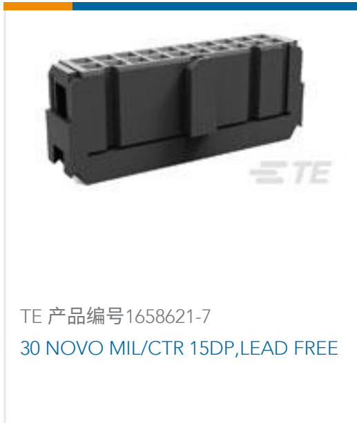
TE 产品编号1658621-7 30 NOVO MIL/CTR 15DP, LEAD FREE