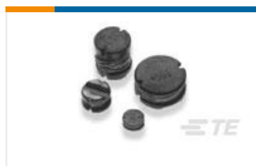
TE 产品编号1-1676955-6 3621D 2200UH 10%