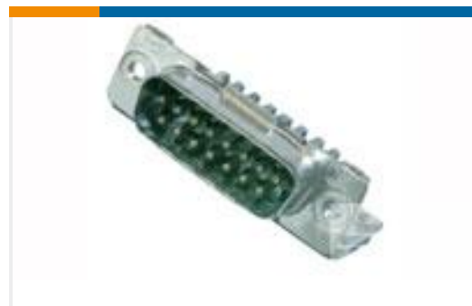
TE 产品编号5-338169-2 15P HDP20 PLUG ASSY