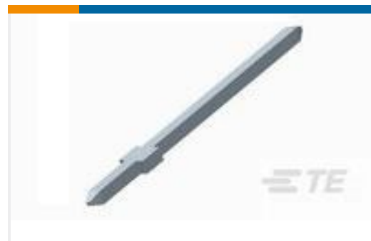
TE 产品编号1-928776-3 MOD2 STIFT M A-PIN