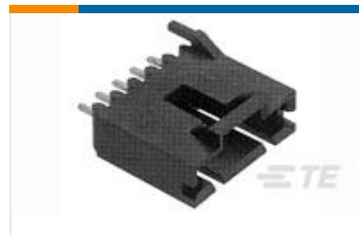
TE 产品编号104809-6 07 MTE HDR SRST LATCH W/HLDWN