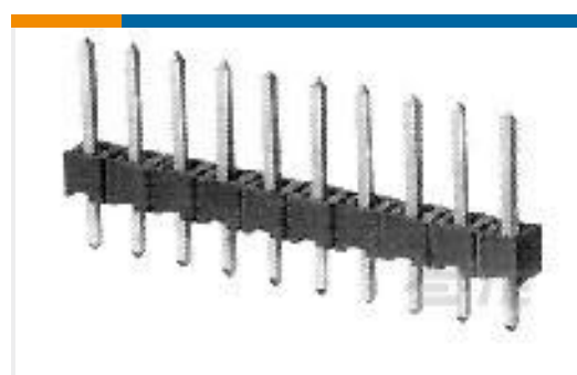
TE 产品编号826938-4 4P AMPMODU II STIFT LEI