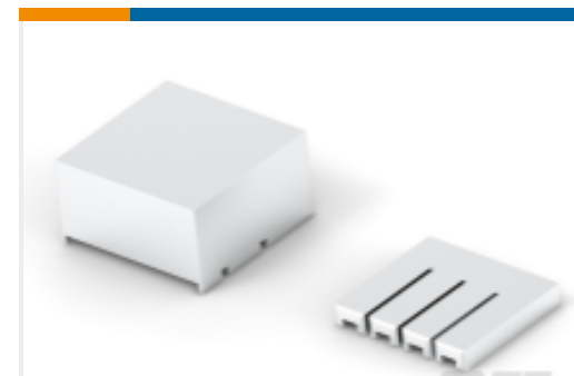
TE 产品编号1725761-1 KIT, SEATING TOOL, 1X4