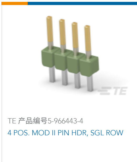
TE 产品编号5-966443-4 4 POS. MOD II PIN HDR, SGL ROW