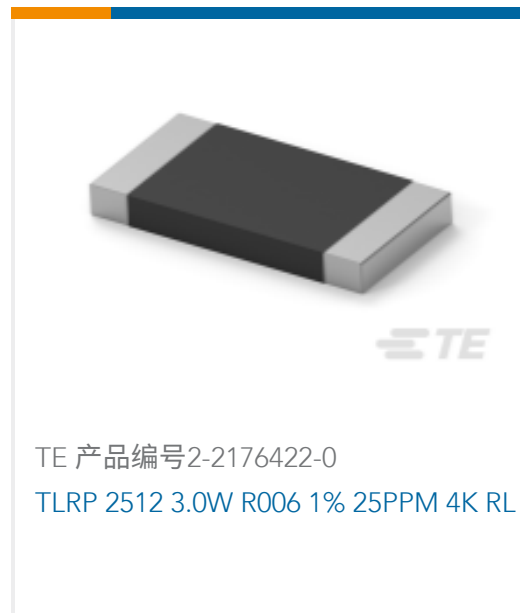
TE 产品编号2-2176422-0 TLRP 2512 3.0W R006 1% 25PPM 4K RL