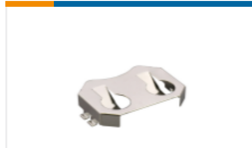
TE 产品编号BAT-HLD-001 Battery Holder 2032 2025 SMT Bulk Pack