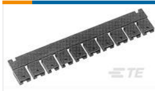
TE 产品编号382811-6 SHUNT, ECON, PHBR 15 AU,BLACK