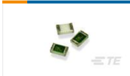
TE 产品编号1-1879417-7 CPF 0603 820K 0.1% 25PPM 1K RL