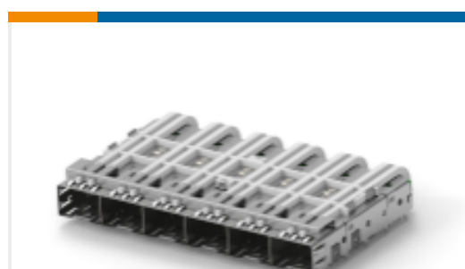
TE 产品编号1658939-3 SFP 1X6 CAGE & LIGHT PIPE KIT