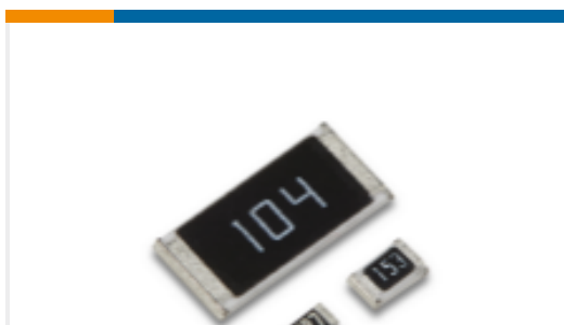
TE 产品编号2-2176339-8 CRGCO 0603 1K8 1%