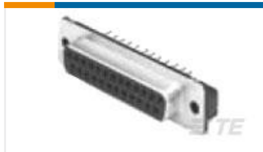
TE 产品编号2-5747706-0 09 RCPT SP/FMS BRDLK