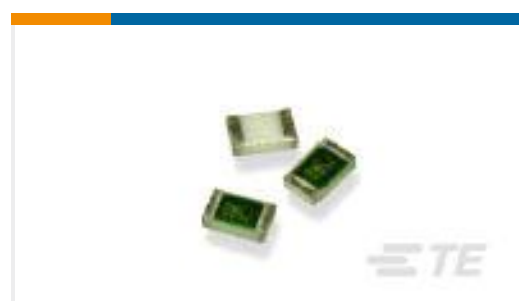
TE 产品编号2-1879338-3 CPF 0603 45K3 1% 50PPM 1K RL