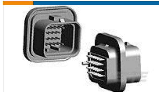
TE 产品编号6473418-1 SUPER SEAL 26POS CAP ASSY V AU