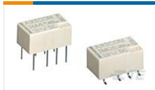
TE 产品编号1462039-2 IM07CGR=IM RELAY 200mW 24V HDV