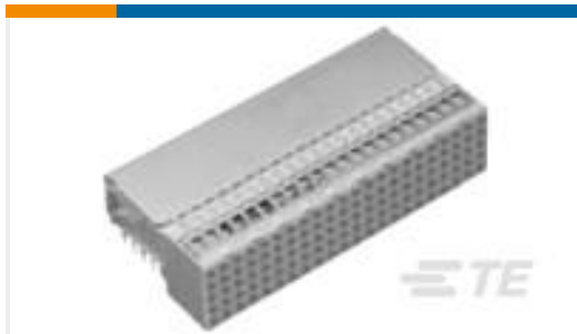
TE 产品编号5188836-1 Z-PACK/B22 RAF 110P