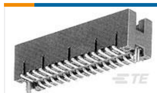
TE 产品编号1-104655-1 100 50/50 HDR DRST SFMNT .250