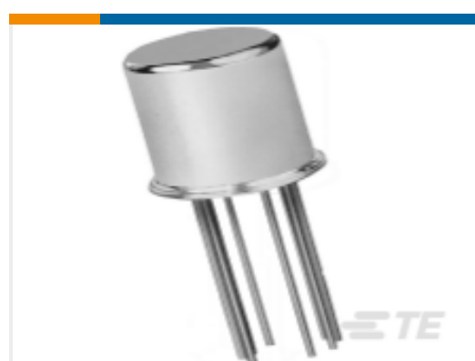
TE 产品编号1617166-8 JMAWT-5XM = M28776/1-013M