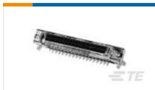
TE 产品编号787190-8 80 50SR R/A RCPT ASSY,REDESIGN