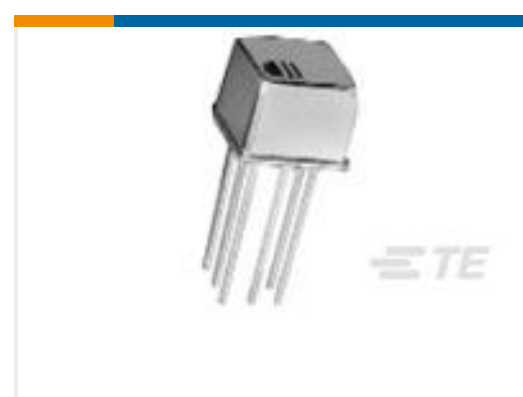
TE 产品编号3-1617146-4 JMGACDG-12LW = M39016/18-052L