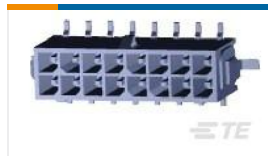
TE 产品编号4-794638-6 16P MICRO MNL ASSY,VRT,SMT,LF