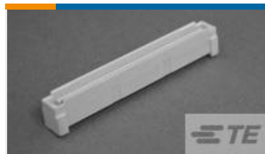
TE 产品编号6123001-3 0.8FH,P08H.5,080,30/Sn,TR,SC