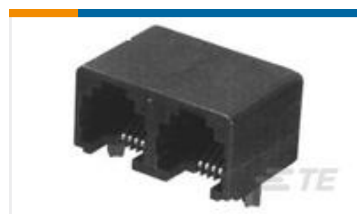
TE 产品编号5406904-1 MJ,RJ11,1X2,6P/4C,BLACK