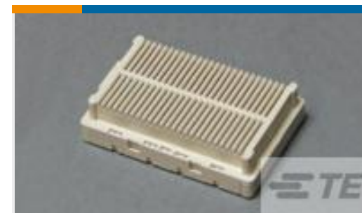
TE 产品编号5-1761615-5 STEP-Z RCPT 05MM 200P LF ST