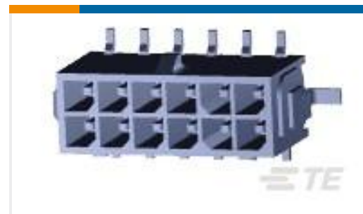
TE 产品编号4-794638-2 12P MICRO MNL ASSY,VRT,SMT,LF