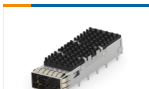
TE 产品编号1-2170704-1 CAGE ASSY, QSFP28 1X1, SPRING, HS