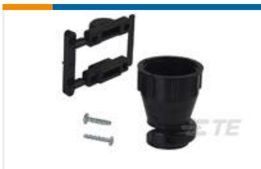
TE 产品编号206070-8 CABLE CLAMP KIT #17