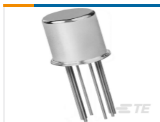
TE 产品编号1617166-8 JMAWT-5XM = M28776/1-013M