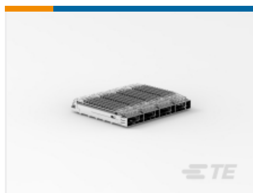
TE 产品编号4-2170747-5 CAGE ASSY, 1X4, QSFP28, SPRING, HS, LP