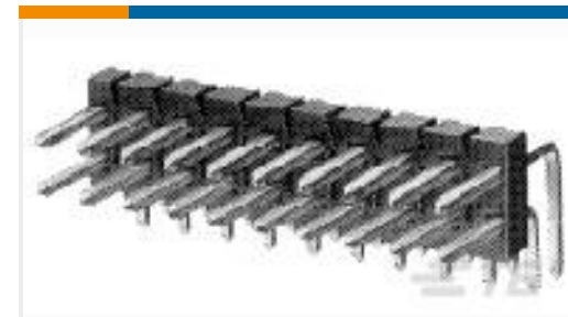
TE 产品编号5-146308-6 12 MODII HDR DRRA B/A .100