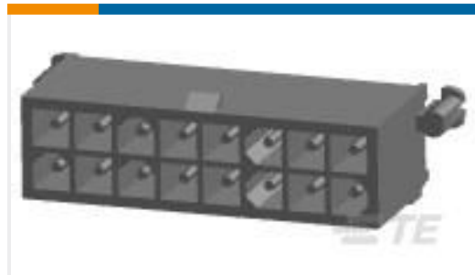
TE 产品编号1-794068-0 16P MINI UMNL HDR W/DH SN