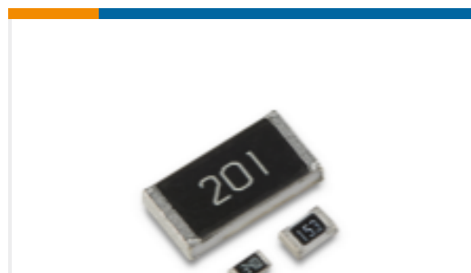
TE 产品编号3-2176330-7 CRGP 2010 10K 1%