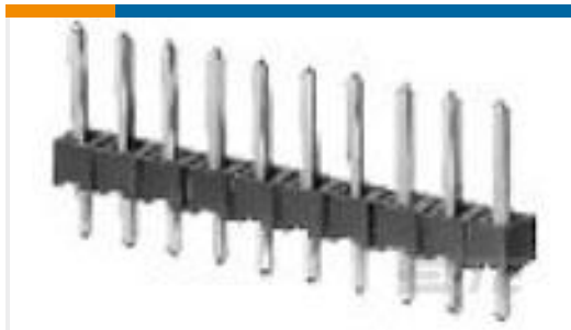
TE 产品编号5-146276-2 02 MODII HDR SRST B/A .100CL