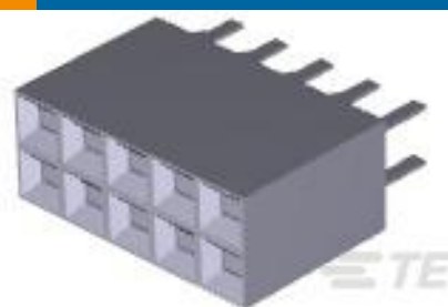
TE 产品编号 146762-2 10 MODII VRT DR CE 100/115