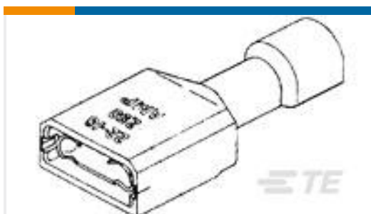
TE 产品编号9-520193-2 ULTRA-FAST 187 ASY REC 22-18 AWG TPBR