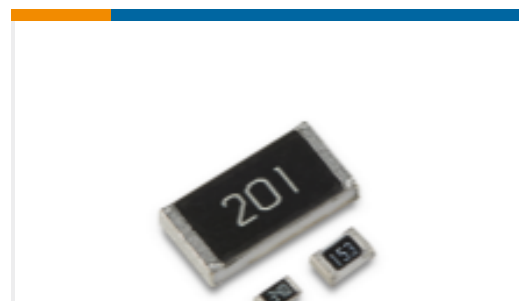
TE 产品编号4-2176330-4 CRGP 2010 39K 1%