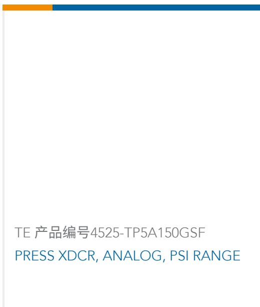
TE 产品编号4525-TP5A150GSF PRESS XDCR, ANALOG, PSI RANGE