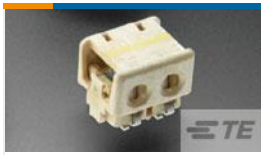
TE 产品编号2-2106431-4 Connector, SMT-IDC PASS THRU, 4 POS, 22