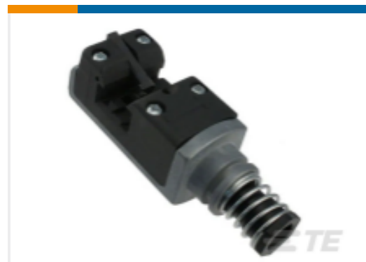
TE 产品编号58247-2 MTA 156 CRIMP HEAD PRODUCTION DISCRETE