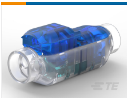
TE 产品编号2213800-2 COOLSPICE NEW STANDARD