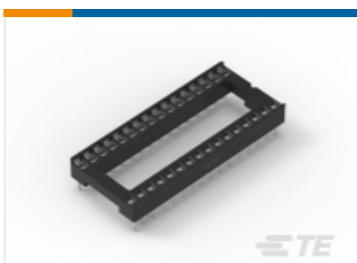
TE 产品编号1-2199300-2 32P,DIP SKT,600 CL,OTC,PB FREE