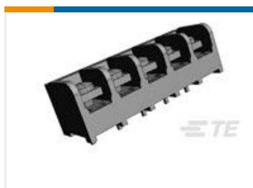
TE 产品编号8-1437652-2 6PCV-05-006=6PCV ASSEMBLY