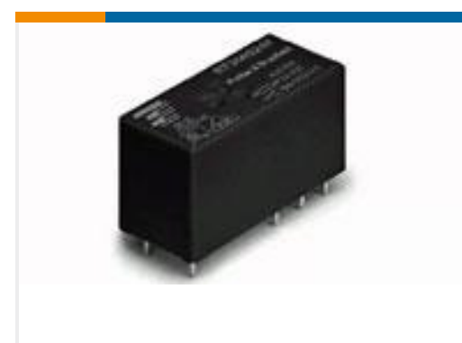
TE 产品编号2-1419108-5 RTB14012F