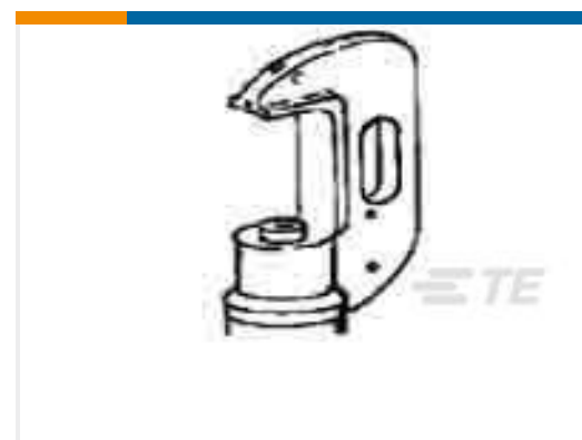
TE 产品编号 69082 HYP8 4/0-1000MCM 26T HEAD