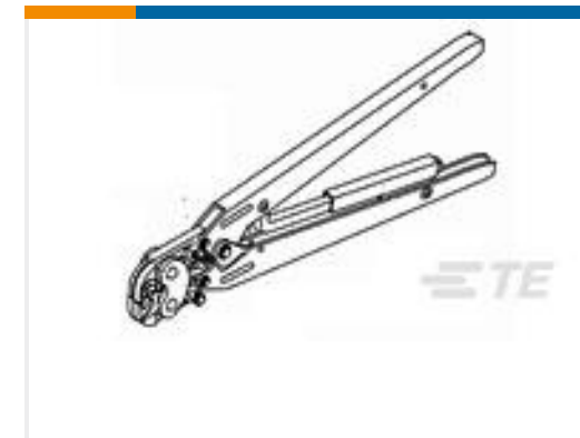
TE 产品编号 47689 DAHT 88 SERIES 14-12 ASSY