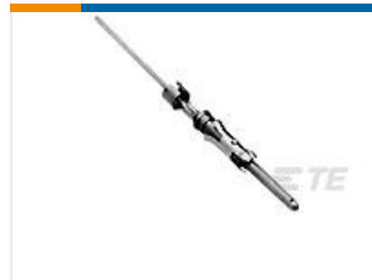
TE 产品编号 66470-9 PIN,.062 DIA,.031X.062 POST,LP