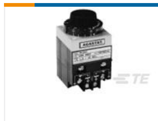
TE 产品编号 5-1423164-0 7022VB=RLY,STD,OFF,2P,32VDC,5