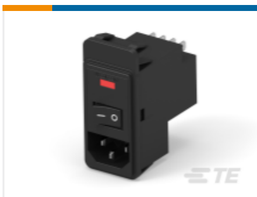
TE 产品编号 6609105-7 PSJS0SBX0=C1104