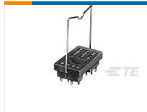
TE 产品编号 4-1393159-1 20C266=SPRING,HOLD-DOWN,R10,.0