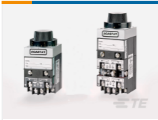
TE 产品编号 1423157-5 7012AC=RLY,STD,ON,2P,120VAC,15