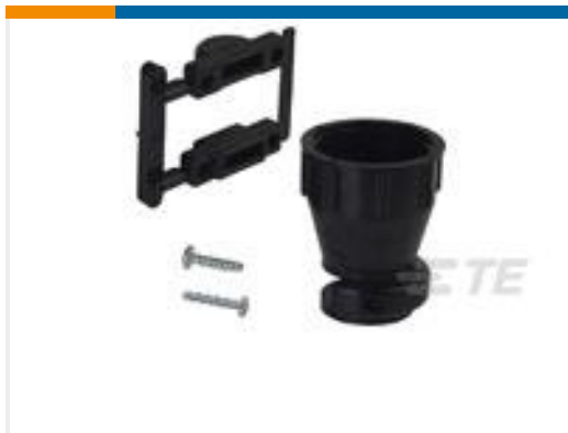
TE 产品编号206070-8 CABLE CLAMP KIT #17