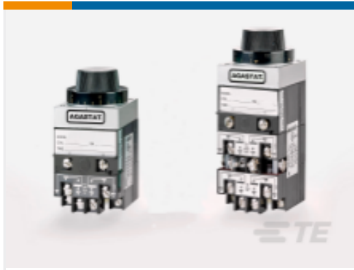
TE 产品编号 2-1423159-6 7012PD=RLY,STD,ON,2P,125VDC,50