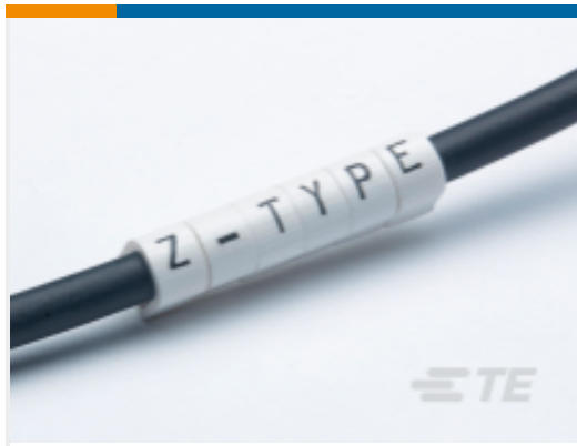
TE 产品编号 EC0437-000 06153411