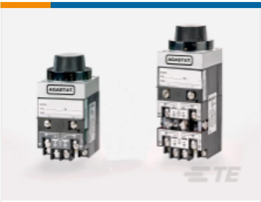
TE 产品编号 1755170-1 7022OCIM=RLY,STD,OFF,2P,24V,15S,I, M