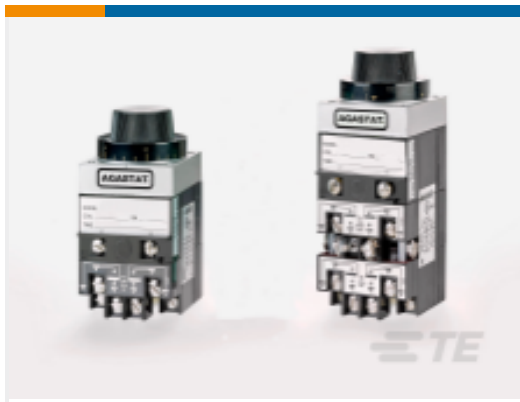
TE 产品编号 1423162-5 7022AC=RLY,STD,OFF,2P 120VAC,1