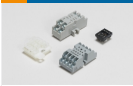
继电器附件、插座和卡箍(54)