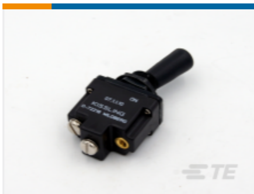
TE 产品编号K1007153 Toggle Switch 08-1-1-13