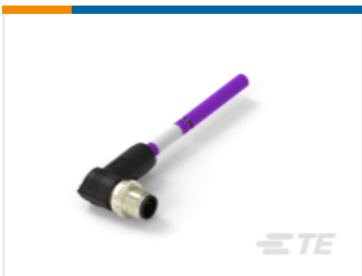
TE 产品编号TAB62246501-040 M12B2-MR-PUR TORSION-4.0M