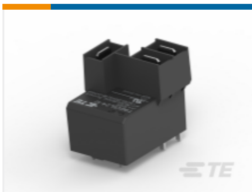
TE 产品编号1558676-6 T9GS1L24-22