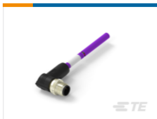
TE 产品编号TAB62246501-040 M12B2-MR-PUR TORSION-4.0M