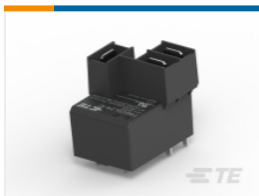
TE 产品编号1558676-6 T9GS1L24-22