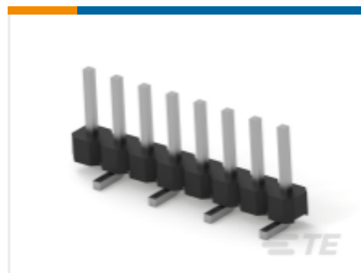
TE 产品编号2842104-8 8P, 2MM, BRK HDR, SRVT, SMD, 0.76AU, TR W/CAP