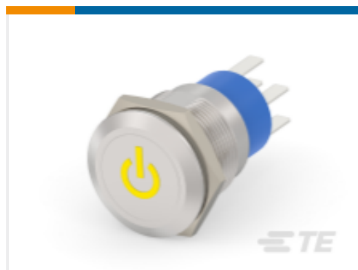
TE 产品编号6-2213766-9 AV19 DPL 5A POWER LED YELLOW 12V