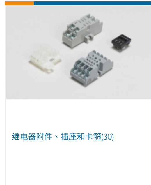
继电器附件、插座和卡箍(30)