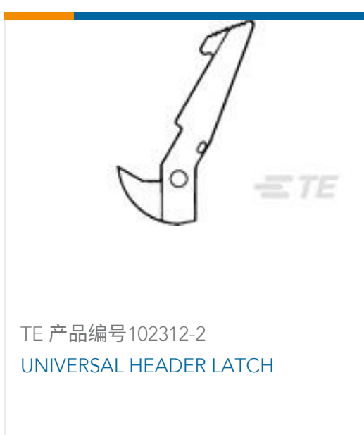
TE 产品编号102312-2 UNIVERSAL HEADER LATCH