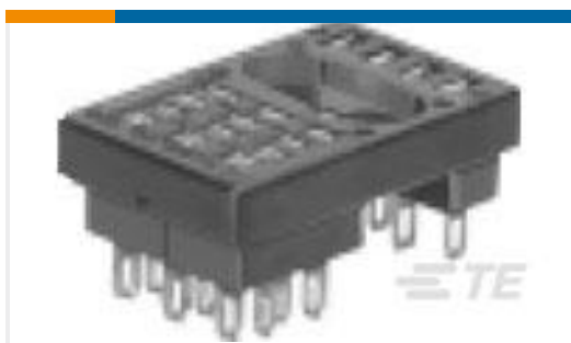
TE 产品编号 4-1393143-2 27E447=SOCKET,R10,4POLE,FLG-MNT,SOLDER