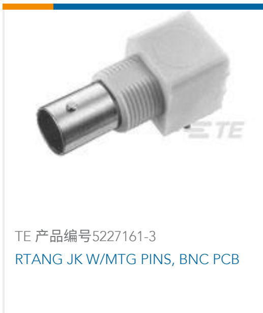
TE 产品编号5227161-3 RTANG JK W/MTG PINS, BNC PCB