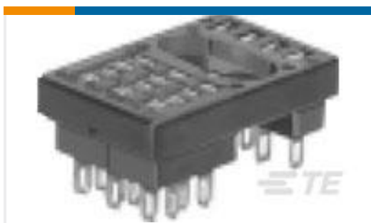
TE 产品编号 2-1393143-5 27E213=SOCKET,R10,16,PC,PHEN