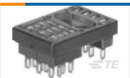
TE 产品编号 2-1393143-2 27E194=SOCKET,R10,16,PC,PHEN