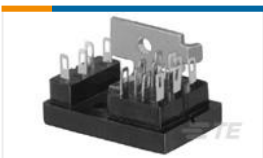
TE 产品编号 1-1393143-5 27E152=SOCKET,R10,ASSY,W/BRK