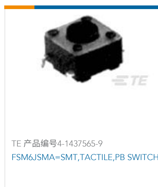
TE 产品编号4-1437565-9 FSM6JSMA=SMT,TACTILE,PB SWITCH