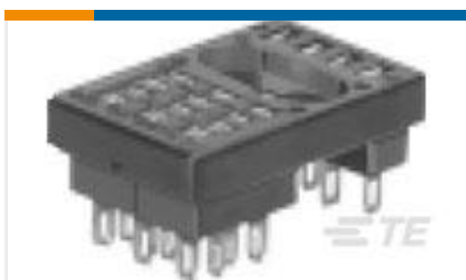
TE 产品编号 1-1393143-2 27E129=SOCKET,R10,16,PC,PHEN