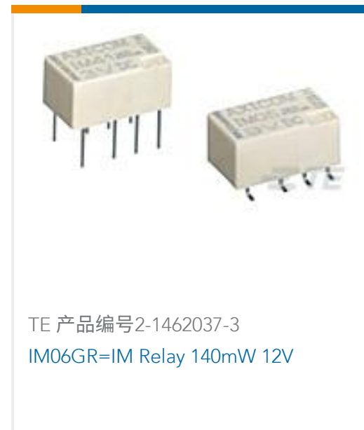
TE 产品编号2-1462037-3 IM06GR=IM Relay 140mW 12V