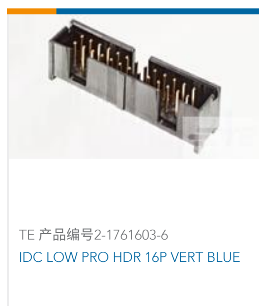
TE 产品编号2-1761603-6 IDC LOW PRO HDR 16P VERT BLUE