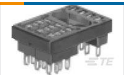
TE 产品编号 5-1393143-1 27E637=SOCKET,R10,4POLE,PCB,210