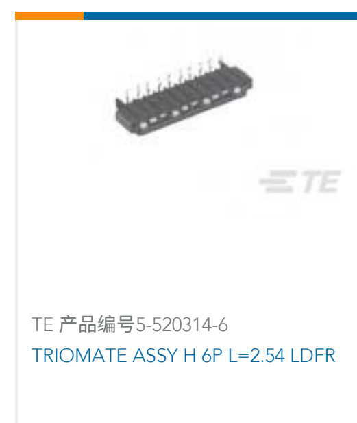
TE 产品编号5-520314-6 TRIOMATE ASSY H 6P L=2.54 LDFR