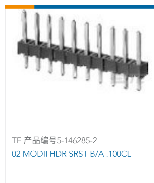
TE 产品编号5-146285-2 02 MODII HDR SRST B/A .100CL