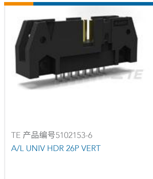
TE 产品编号5102153-6 A/L UNIV HDR 26P VERT