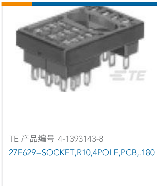
TE 产品编号 4-1393143-8 27E629=SOCKET,R10,4POLE,PCB,.180