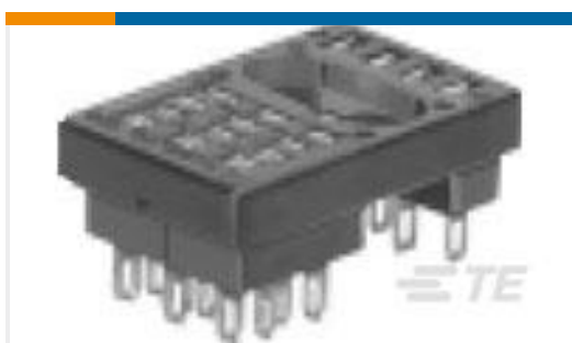
TE 产品编号 1393143-9 27E126=SOCKET,R10,16,SLG,PHE