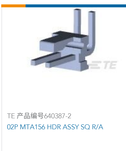
TE 产品编号640387-2 02P MTA156 HDR ASSY SQ R/A