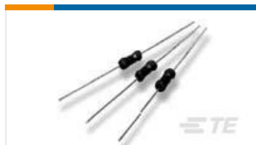
TE 产品编号3-1625892-2 3W SM M/OX 5% 22K