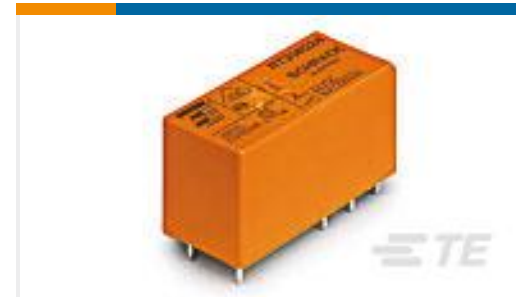
TE 产品编号7-1393239-3 RT31L012