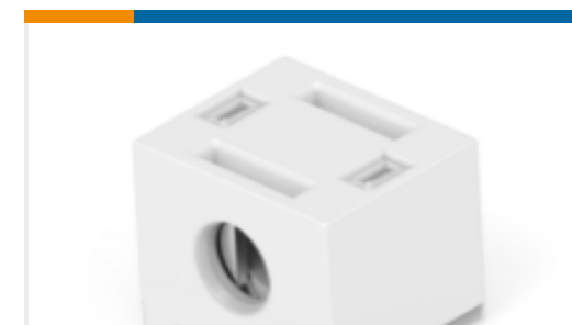
TE 产品编号444347-E IDCTERM 1 IDC24 0,80 * 105 707 0007 J 2