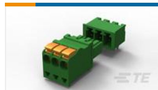
TE 产品编号1-1986692-5 STR PLUG SPRING TYPE RH 15P, 3.50 mm