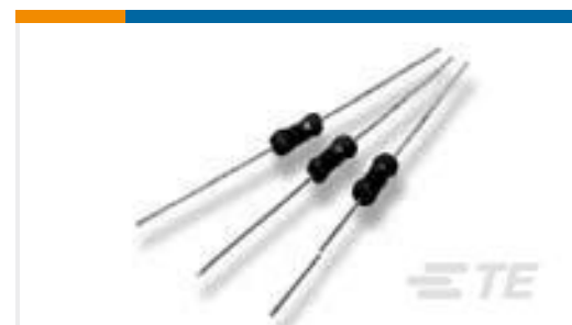
TE 产品编号5-1625892-9 3W SM M/OX 5% 56K