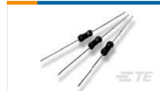
TE 产品编号1625886-2 1W SM M/OX 5% 330K