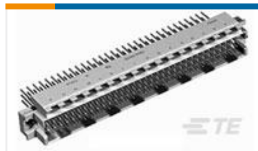
TE 产品编号2-1393659-6 V42254B1201R480=PC612 MESSERLE