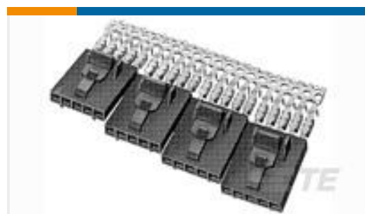
TE 产品编号 5-103957-7 2X8 MTE RCPT SR LATCH .100CL