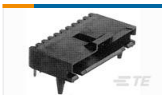
TE 产品编号5-104361-6 07 MTE HDR SRRA LATCH W/HLDWN