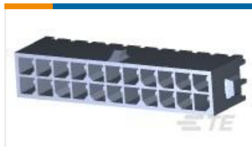
TE 产品编号5-794632-2 22P MICRO MNL ASSY,VRT,HDR,LF