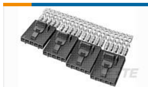
TE 产品编号 5-103960-7 2X8 MTE RCPT SR LATCH .100CL