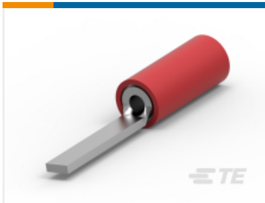
TE 产品编号150730 22-16 PIDG TAB 3,3/3