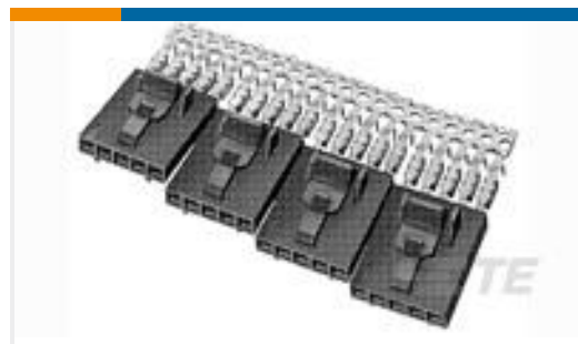
TE 产品编号 5-103961-9 2X10 MTE RCPT SR LATCH .100CL