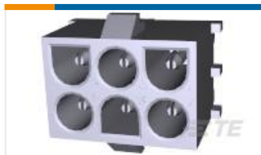
TE 产品编号350732-1 06P UMNL PIN HDR ASSY 94VO