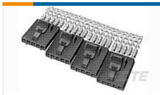
TE 产品编号 103958-9 2X10 MTE RCPT SR LATCH .100CL