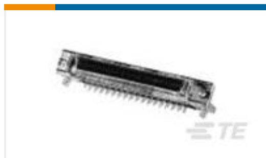
TE 产品编号5787266-5 50 50SR R/A RCPT ASSY,RDSN L/F