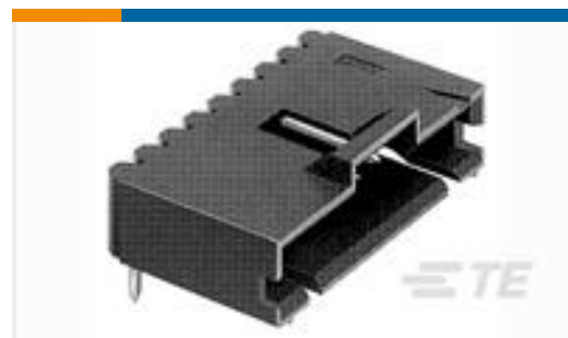
TE 产品编号5-104935-1 04 MTE HDR SRRA LATCH