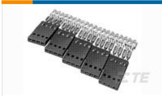
TE 产品编号 5-103973-9 2X10 MTE RCPT SR RIBBED .100CL