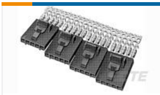
TE 产品编号 5-103958-9 2X10 MTE RCPT SR LATCH .100CL