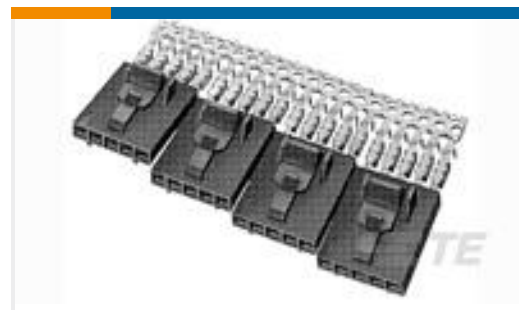
TE 产品编号 103961-9 2X10 MTE RCPT SR LATCH .100CL