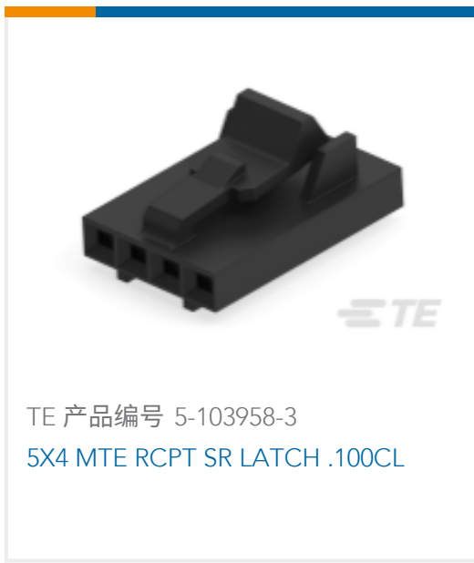
TE 产品编号 5-103958-3 5X4 MTE RCPT SR LATCH .100CL