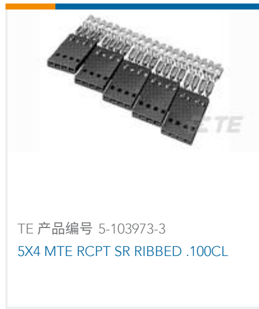
TE 产品编号 5-103973-3 5X4 MTE RCPT SR RIBBED .100CL