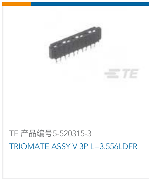
TE 产品编号5-520315-3 TRIOMATE ASSY V 3P L=3.556LDFR