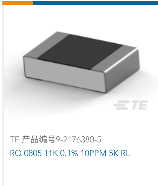
TE 产品编号9-2176380-5 RQ 0805 11K 0.1% 10PPM 5K RL