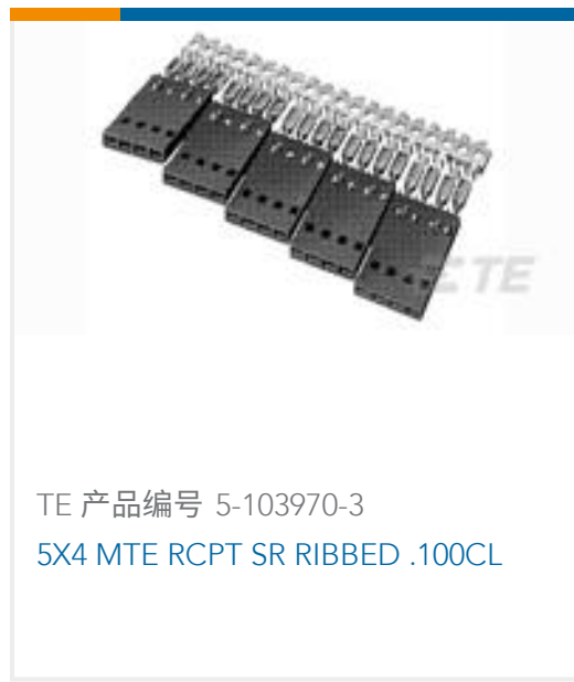
TE 产品编号 5-103970-3 5X4 MTE RCPT SR RIBBED .100CL