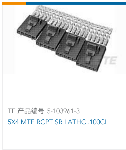
TE 产品编号 5-103961-3 5X4 MTE RCPT SR LATHC .100CL