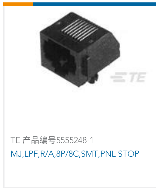
TE 产品编号5555248-1 MJ,LPF,R/A,8P/8C,SMT,PNL STOP