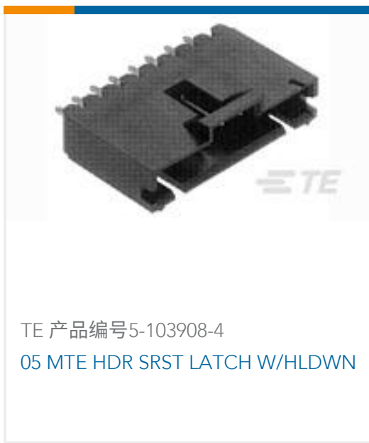
TE 产品编号5-103908-4 05 MTE HDR SRST LATCH W/HLDWN