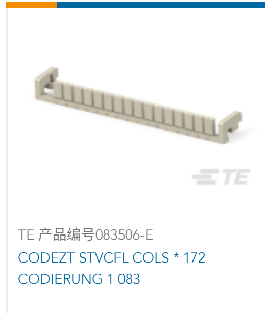
TE 产品编号083506-E CODEZT STVCFL COLS * 172 CODIERUNG 1 083