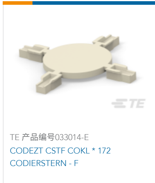
TE 产品编号033014-E CODEZT CSTF COKL * 172 CODIERSTERN - F