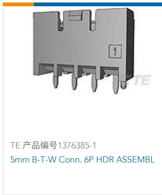
TE 产品编号1376385-1 5mm B-T-W Conn. 6P HDR ASSEMBL