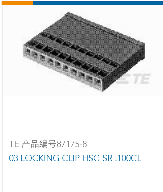
TE 产品编号87175-8 03 LOCKING CLIP HSG SR .100CL