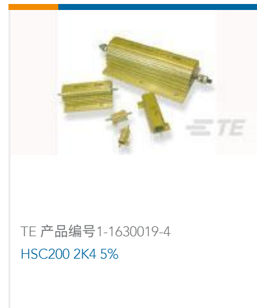
TE 产品编号1-1630019-4 HSC200 2K4 5%