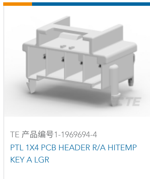
TE 产品编号1-1969694-4 PTL 1X4 PCB HEADER R/A HITEMP KEY A LGR