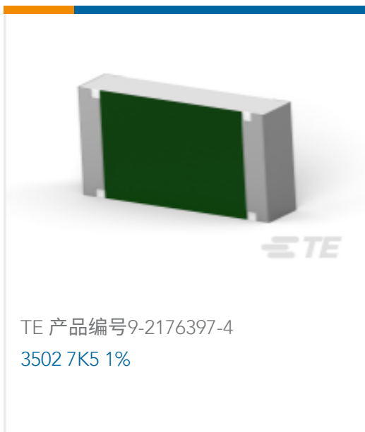
TE 产品编号9-2176397-4 3502 7K5 1%