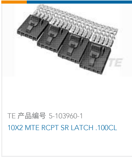
TE 产品编号 5-103960-1 10X2 MTE RCPT SR LATCH .100CL