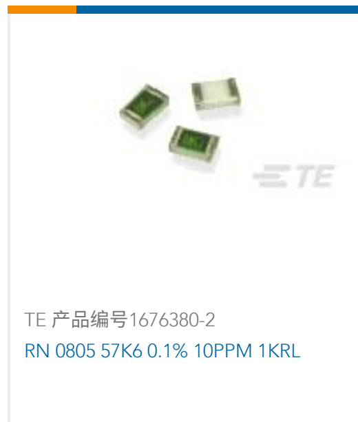
TE 产品编号1676380-2 RN 0805 57K6 0.1% 10PPM 1KRL