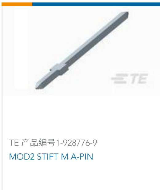
TE 产品编号1-928776-9 MOD2 STIFT M A-PIN