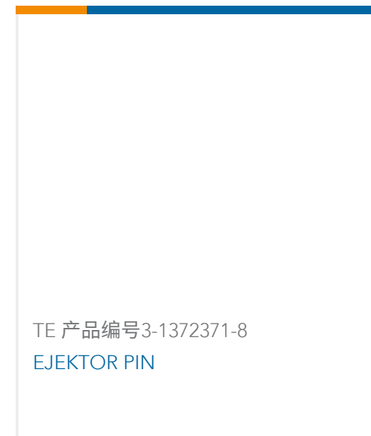
TE 产品编号3-1372371-8 EJEKTOR PIN