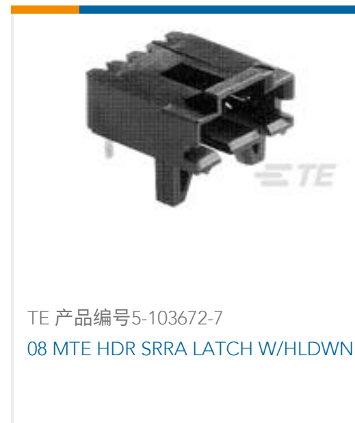
TE 产品编号5-103672-7 08 MTE HDR SRRA LATCH W/HLDWN