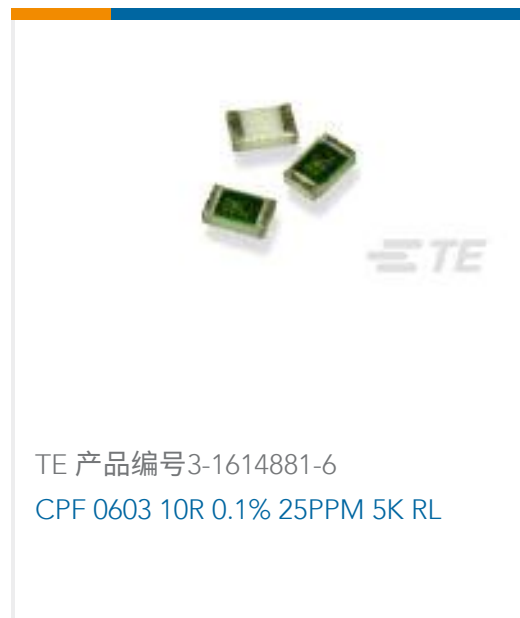
TE 产品编号3-1614881-6 CPF 0603 10R 0.1% 25PPM 5K RL