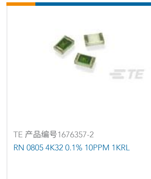
TE 产品编号1676357-2 RN 0805 4K32 0.1% 10PPM 1KRL