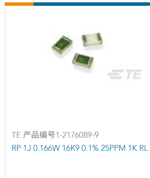
TE 产品编号1-2176089-9 RP 1J 0.166W 16K9 0.1% 25PPM 1K RL