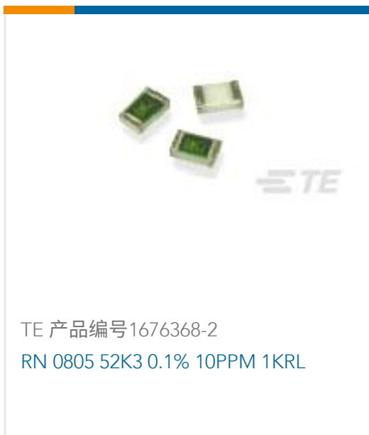
TE 产品编号1676368-2 RN 0805 52K3 0.1% 10PPM 1KRL