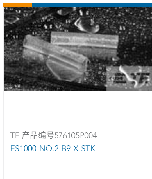
TE 产品编号576105P004 ES1000-NO.2-B9-X-STK