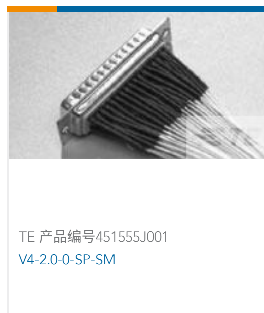
TE 产品编号451555J001 V4-2.0-0-SP-SM