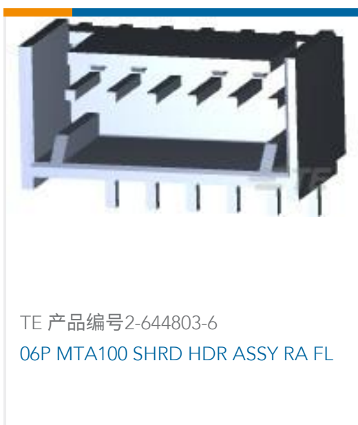
TE 产品编号2-644803-6 06P MTA100 SHRDR HDR ASSY RA FL