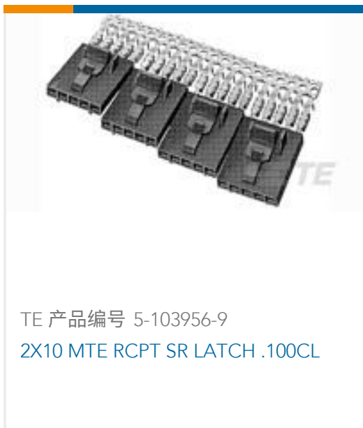
TE 产品编号 5-103956-9 2X10 MTE RCPT SR LATCH .100CL