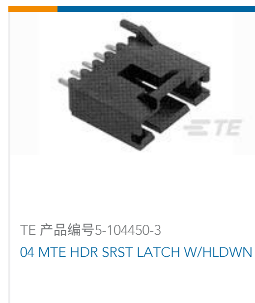
TE 产品编号5-104450-3 04 MTE HDR SRST LATCH W/HLDWN