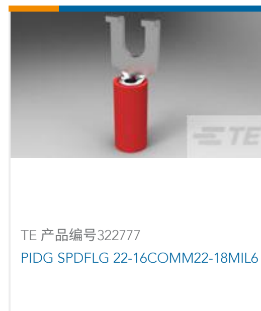
TE 产品编号322777 PIDG SPDFLG 22-16COMM22-18MIL6