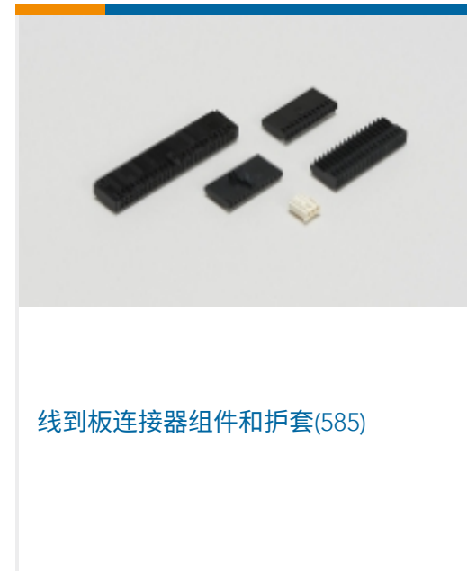
线到板连接器组件和护套(585)