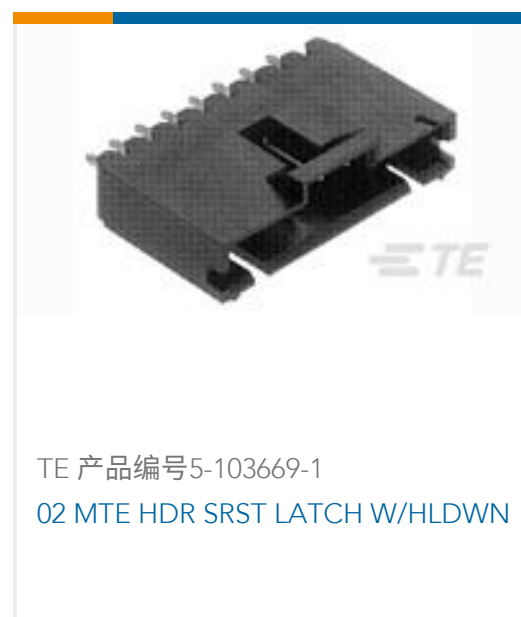
TE 产品编号5-103669-1 02 MTE HDR SRST LATCH W/HLDWN