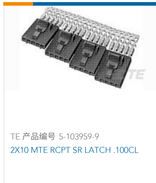
TE 产品编号 5-103959-9 2X10 MTE RCPT SR LATCH .100CL