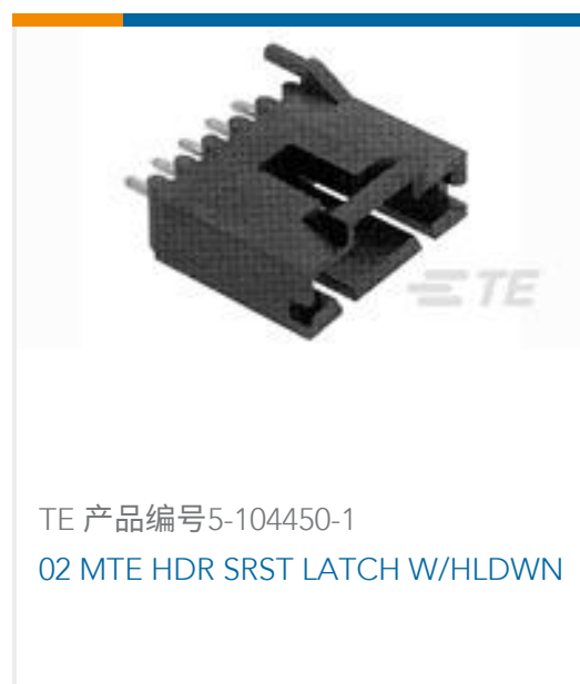
TE 产品编号5-104450-1 02 MTE HDR SRST LATCH W/HLDWN