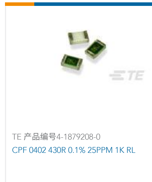
TE 产品编号4-1879208-0 CPF 0402 430R 0.1% 25PPM 1K RL