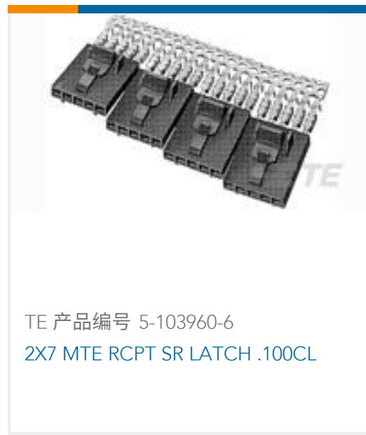
TE 产品编号 5-103960-6 2X7 MTE RCPT SR LATCH .100CL