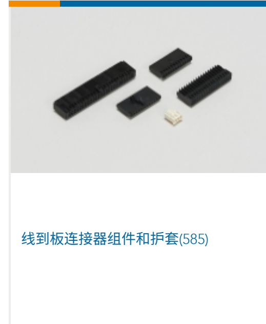
线到板连接器组件和护套(585)