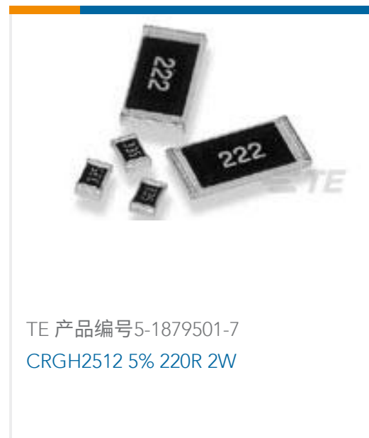
TE 产品编号5-1879501-7 CRGH2512 5% 220R 2W