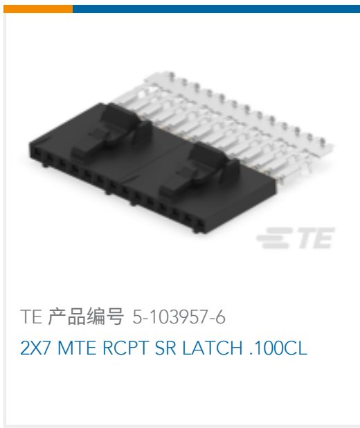
TE 产品编号 5-103957-6 2X7 MTE RCPT SR LATCH .100CL