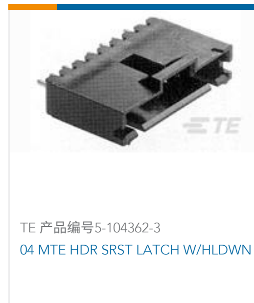
TE 产品编号5-104362-3 04 MTE HDR SRST LATCH W/HLDWN