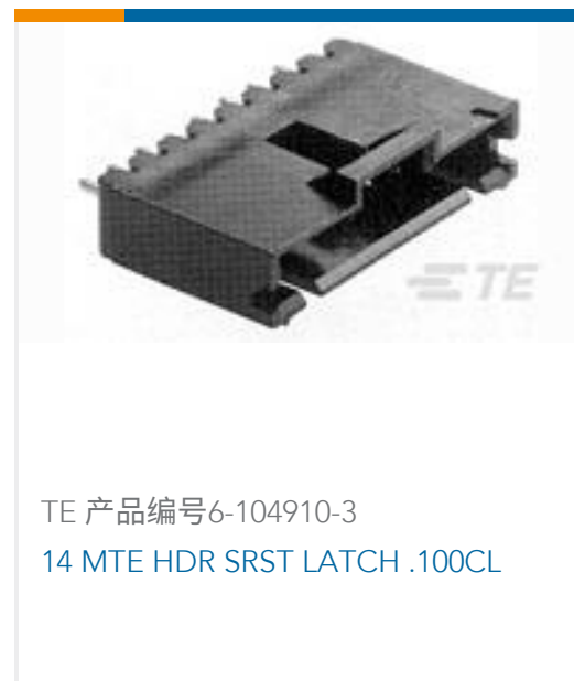
TE 产品编号6-104910-3 14 MTE HDR SRST LATCH .100CL