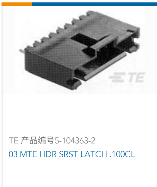
TE 产品编号5-104363-2 03 MTE HDR SRST LATCH .100CL