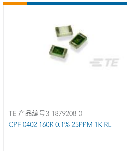
TE 产品编号3-1879208-0 CPF 0402 160R 0.1% 25PPM 1K RL