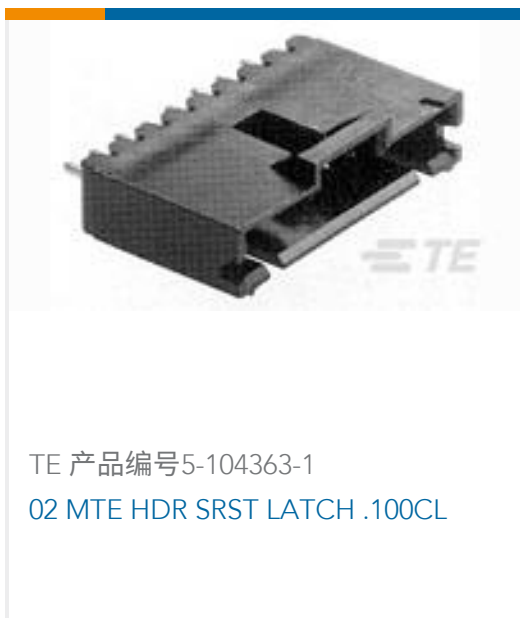
TE 产品编号5-104363-1 02 MTE HDR SRST LATCH .100CL