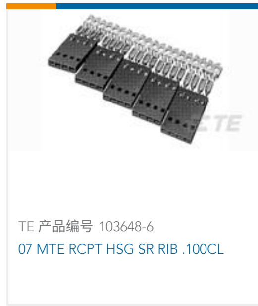
TE 产品编号 103648-6 07 MTE RCPT HSG SR RIB .100CL