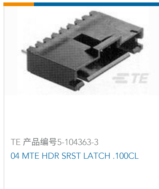
TE 产品编号5-104363-3 04 MTE HDR SRST LATCH .100CL