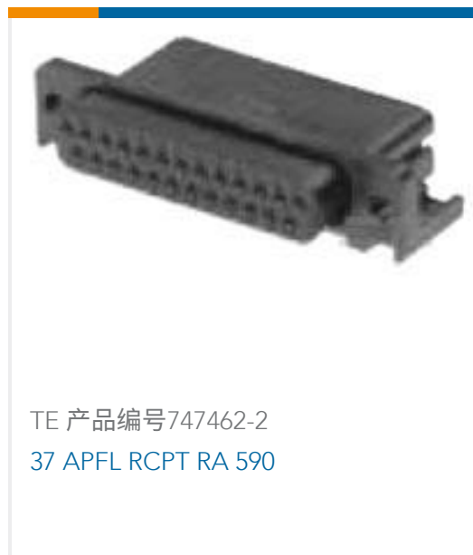
TE 产品编号 747462-2 37 APFL RCPT RA 590