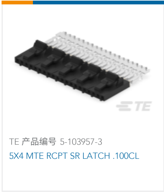
TE 产品编号 5-103957-3 5X4 MTE RCPT SR LATCH .100CL