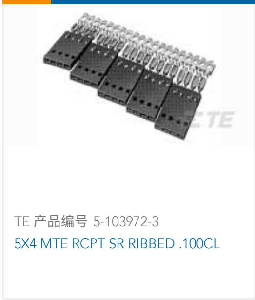
TE 产品编号 5-103972-3 5X4 MTE RCPT SR RIBBED .100CL