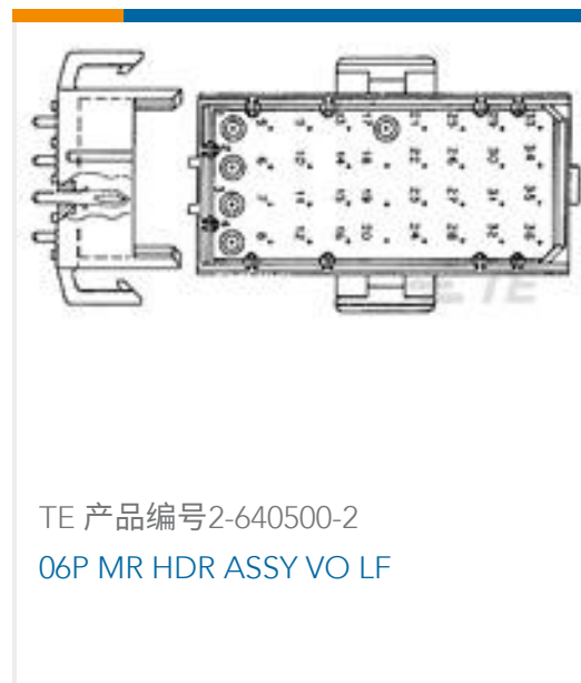
TE 产品编号 2-640500-2 06P MR HDR ASSY VO LF