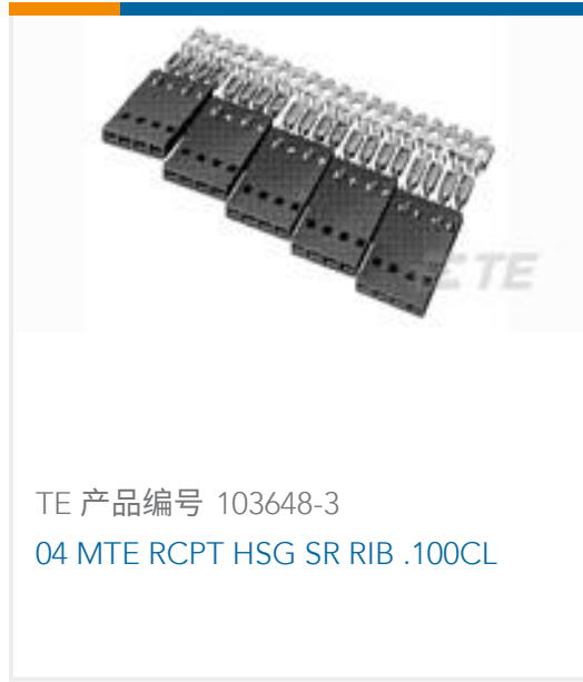
TE 产品编号 103648-3 04 MTE RCPT HSG SR RIB .100CL