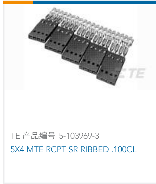
TE 产品编号 5-103969-3 5X4 MTE RCPT SR RIBBED .100CL