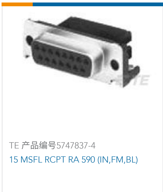
TE 产品编号 5747837-4 15 MSFL RCPT RA 590 (IN,FM,BL)