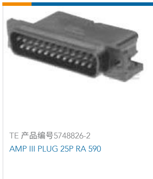
TE 产品编号 5748826-2 AMP III PLUG 25P RA 590