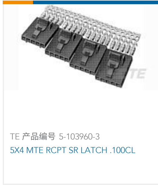
TE 产品编号 5-103960-3 5X4 MTE RCPT SR LATCH .100CL