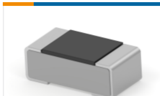
TE 产品编号4-2176338-3 CRGCQ 0402 10M 5%