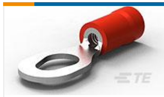
TE 产品编号54774-2 PG R 22-16COM 22-18MIL 6-8-10