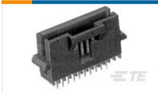
TE 产品编号5-104071-2 05 SYSTEM 50 HDR SRST SHRD SN