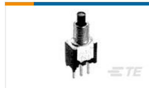
TE 产品编号1825098-1 TPC11CGPC004