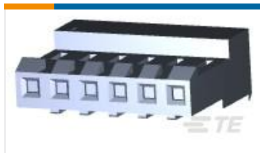
TE 产品编号3-640426-6 06P MTA156 CONN ASSY 18AWG ORA