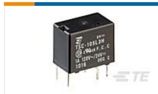
TE 产品编号1-1419130-2 TSC-105L3H,000