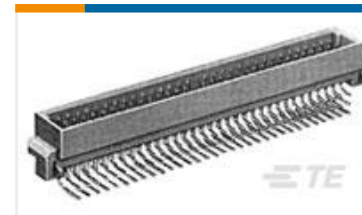
TE 产品编号650945-5 064 EURO TYPE C PIN ST ASSY