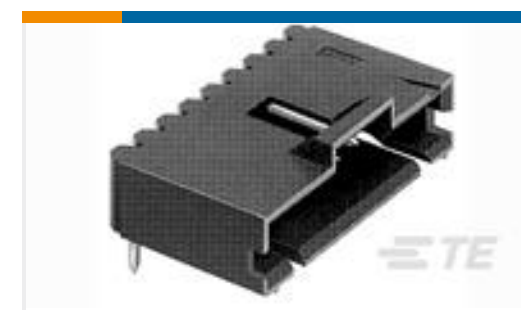
TE 产品编号5-103635-5 06 MTE HDR SRRA LTCH.100CL LF