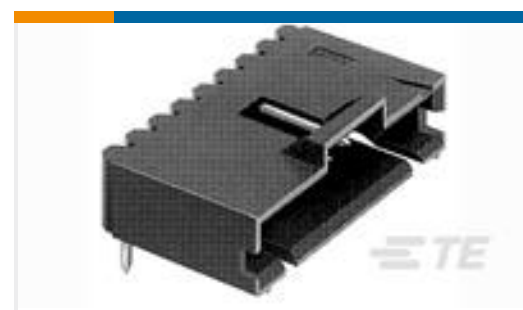
TE 产品编号5-103635-7 08 MTE HDR SRRA LTCH.100CL LF