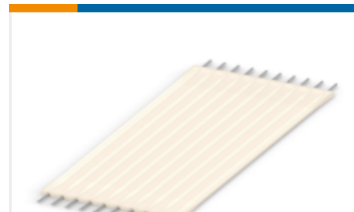
TE 产品编号4-1474644-0 FSN-23A-20