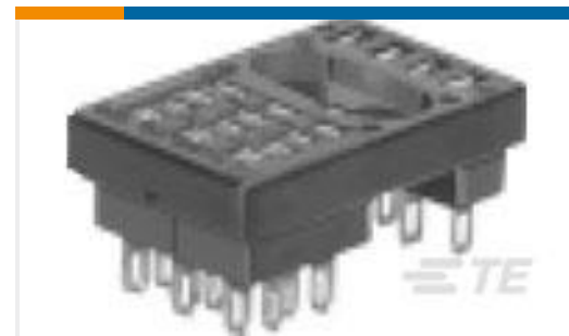
TE 产品编号1-1393143-0 27E127=SOCKET,R10,22,SLG,PHE