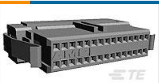
TE 产品编号2-111196-7 016 RCPT SYSTEM 50 30 DPLX