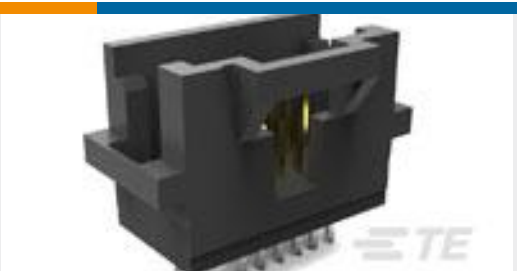
TE 产品编号6-104068-0 16 SYSTEM 50 HDR DRST SHRD