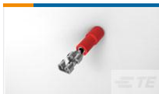
TE 产品编号640925-1 RECEPT, PIDG FASTON 22-18 110