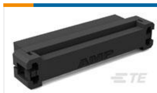
TE 产品编号1-111623-8 10, 2MM, POL, 30 DP, LEAD FREE