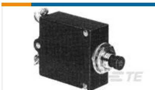
TE 产品编号7-1393246-4 W23-X1A1G-40=W23/W31