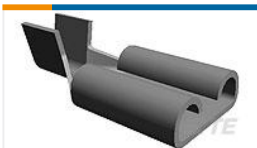
TE 产品编号60601-1 110 FASTON REC 20-18 AWG TPBR