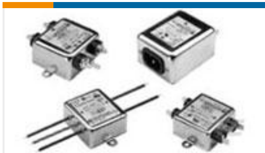
TE 产品编号2-6609028-4 40VK6C=F7865 S0