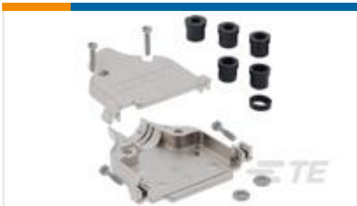
TE 产品编号5748676-3 DIE CAST CBL CLMP KIT,SZ 3