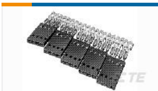
TE 产品编号5-103974-7 2X8 MTE RCPT SR PLAIN .100CL