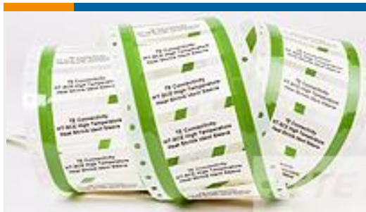
TE 产品编号3206430001 HT-SCE-3/16-2.0-9