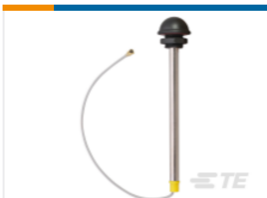
TE 产品编号L9000163-01 Antenna Dome 916MHz 1.32 150 UFL