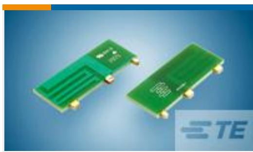
TE 产品编号1513168-1 PCB Antenna Single Band