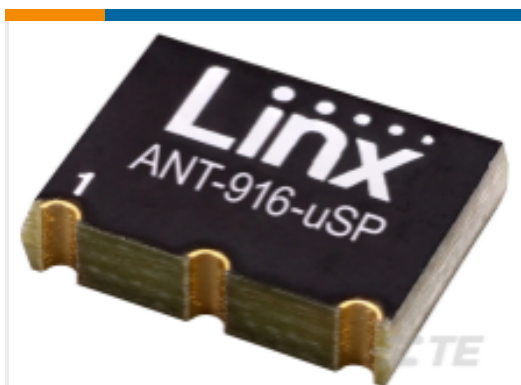
TE 产品编号ANT-916-USP Antenna uSP PCB RPC 916MHz SMT