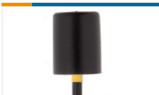
TE 产品编号ANT-916-JJB-RA Antenna Mini R-Angle 916MHz THM