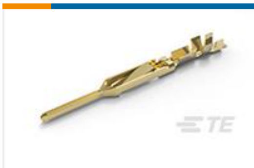
TE 产品编号88048-4 FFC PIN CONTACT AU