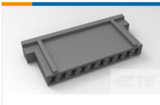
TE 产品编号88859-1 006 HOUSING FFC RCPT SR 100CL