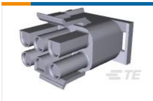
TE 产品编号794096-1 06P UMNL PLUG