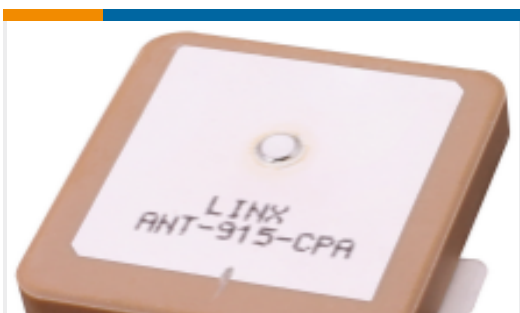
TE 产品编号ANT-915-CPA Antenna CER Patch 40mm Sq 915MHz Adh THM