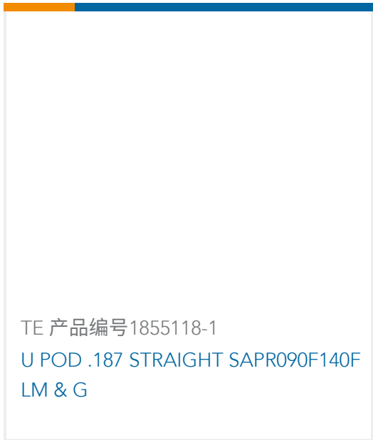
TE 产品编号 1855118-1 U POD .187 STRAIGHT SAPR090F140F LM & G