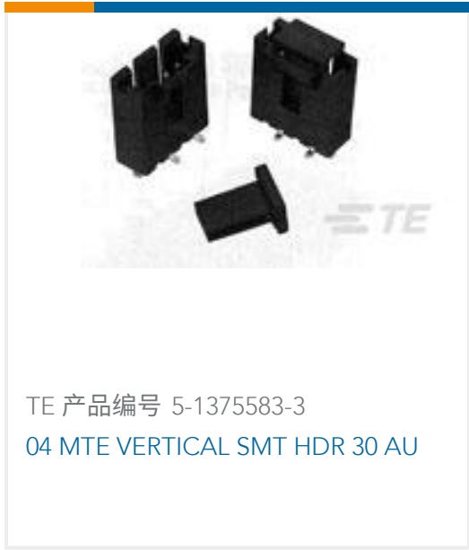
TE 产品编号 5-1375583-3 04 MTE VERTICAL SMT HDR 30 AU