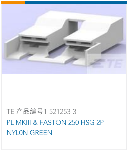
TE 产品编号 1-521253-3 PL MKIII & FASTON 250 HSG 2P NYLON GREEN