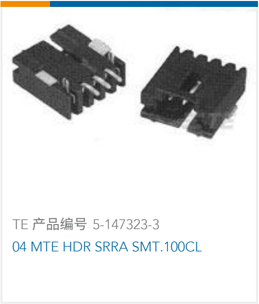
TE 产品编号 5-147323-3 04 MTE HDR SRRA SMT .100CL