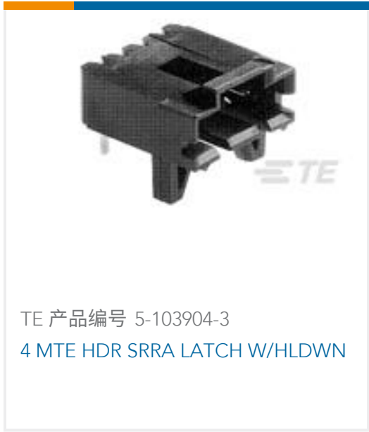
TE 产品编号 5-103904-3 4 MTE HDR SRRA LATCH W/HLDWN