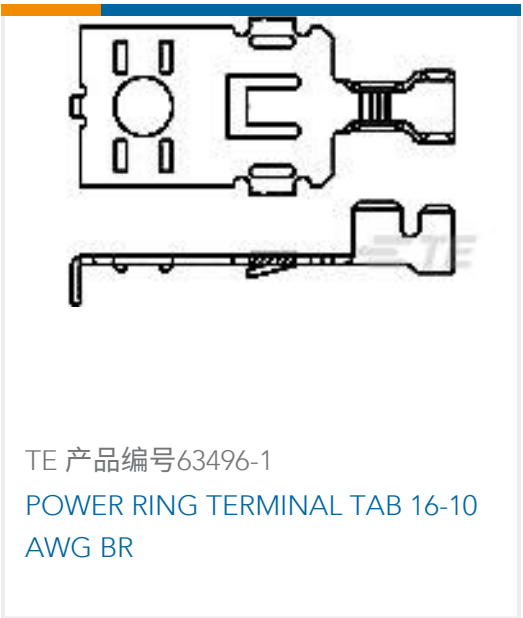
TE 产品编号 63496-1 POWER RING TERMINAL TAB 16-10 AWG BR