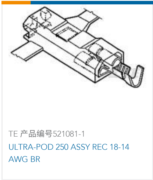
TE 产品编号 521081-1 ULTRA-POD 250 ASSY REC 18-14 AWG BR