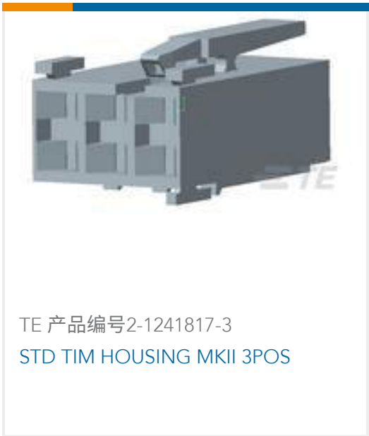
TE 产品编号 2-1241817-3 STD TIM HOUSING MKII 3POS