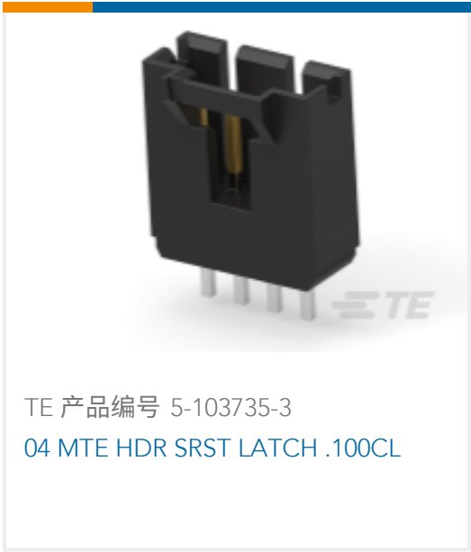
TE 产品编号 5-103735-3 04 MTE HDR SRST LATCH .100CL